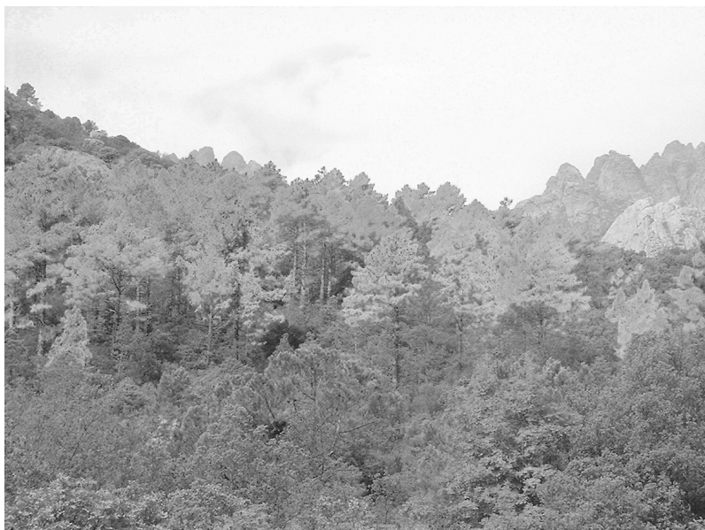
Photo 2 : Dépérissement du pin maritime en Corse, forêt de Popolasca (Haute-Corse)

nées recueillies sur un test de descendance comprenant 61 familles de plein-frères (1845 arbres mesurés) et situé en Aquitaine montre une relation positive et significative entre l'épaisseur d'écorce moyenne et le diamètre à 1m30. Ce résultat confirme que l'augmentation de la vigueur des arbres (par fertilisation ou éclaircie) pourrait contribuer à améliorer la résistance phénotypique du pin maritime à M. feytaudi .