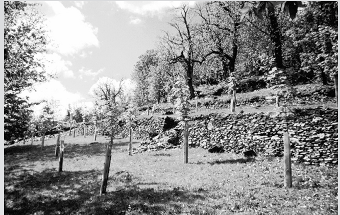
Mise en valeur de parcelles en terrasses en Cévennes