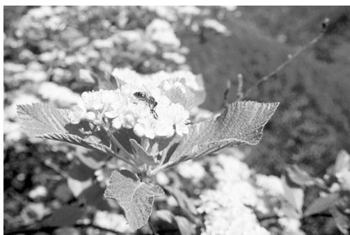
Photo de gauche : Fleurs d'alisier blanc ( Sorbus aria ) butinées.