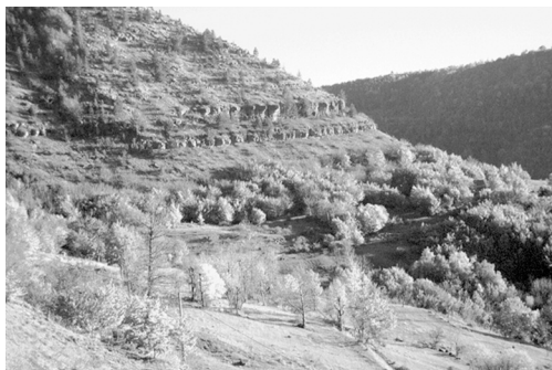
Photo ci-contre : Nuances d'automne apportées par la présence d'érables...

La bibliographie concernant le potentiel mellifère des arbres et arbustes est peu abondante et rarement scientifique. Provenant souvent d'amateurs observateurs, les informations fournies sont imprécises, voire contradictoires. Elles demeurent toutefois pour nous des hypothèses de travail qu'il conviendra de vérifier dans les arboretums installés. Certains travaux consultés fournissent des estimations de production potentielle de miel par arbre ou par hectare de plantations ; ces estimations sont souvent faites de façon théorique, en prélevant le nectar directement dans les nectaires avec de petites pipettes ; les résultats unitaires sont multipliés par le nombre de fleurs par