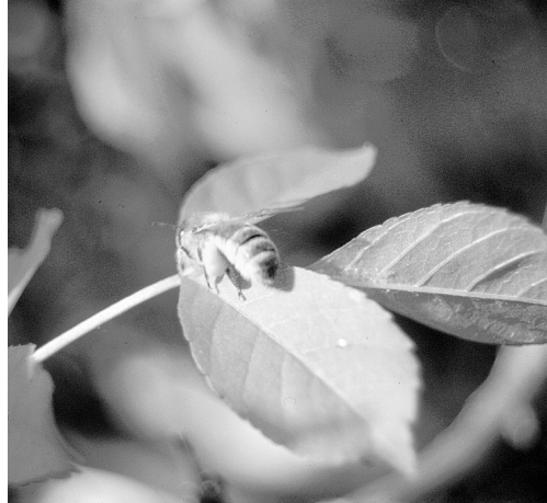
Photos ci-contre : Après le travail de récolte sur le frêne à fleurs, le repos bien mérité sur la feuille du même arbre.