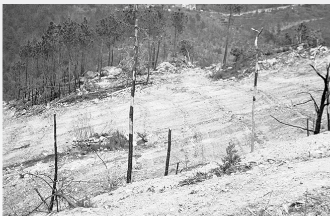
Remise en valeur après incendie d'une parcelle de pins maritimes. A gauche : en cours de travaux. A droite : 9 ans après.