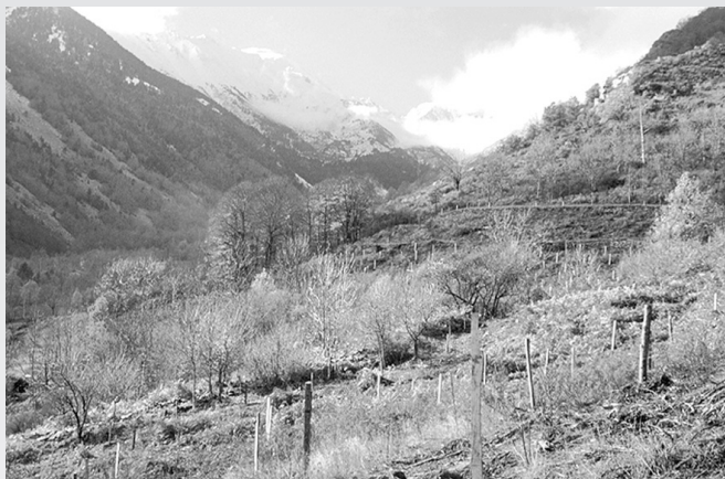
Mise en valeur d'espaces ruraux abandonnés en montagne dans les Pyrénées. A gauche : la première année. A droite : 4 ans après.