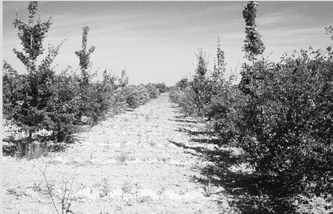
Mise en valeur d'une friche viticole.

Nous illustrons quelques exemples ci-dessous avec des photos.