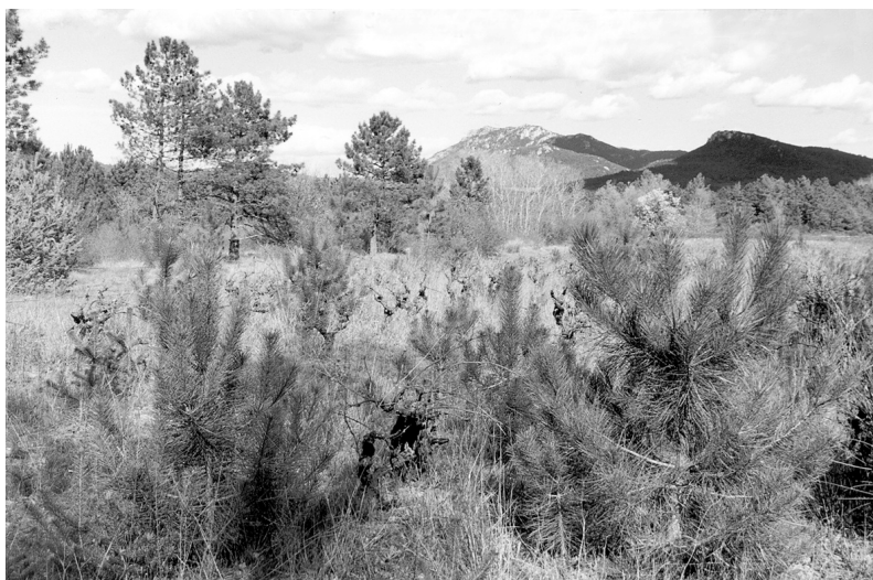
Photo 2 : Colonisation d'une vigne en friche par le pin maritime, à Mazaugues (Var), printemps 2004.

2 - Cf. Articles précédents dans ce numéro.