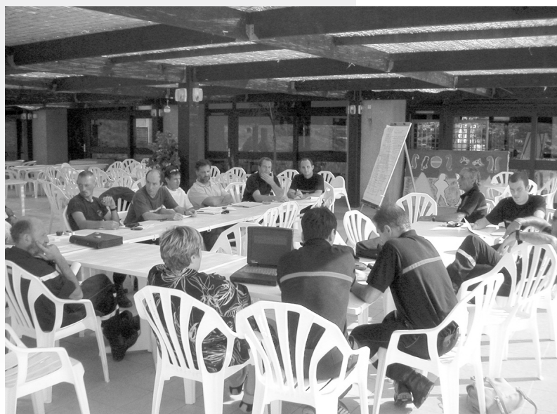
Photo 4 : Fin de saison 2003 : débriefing inter-services .