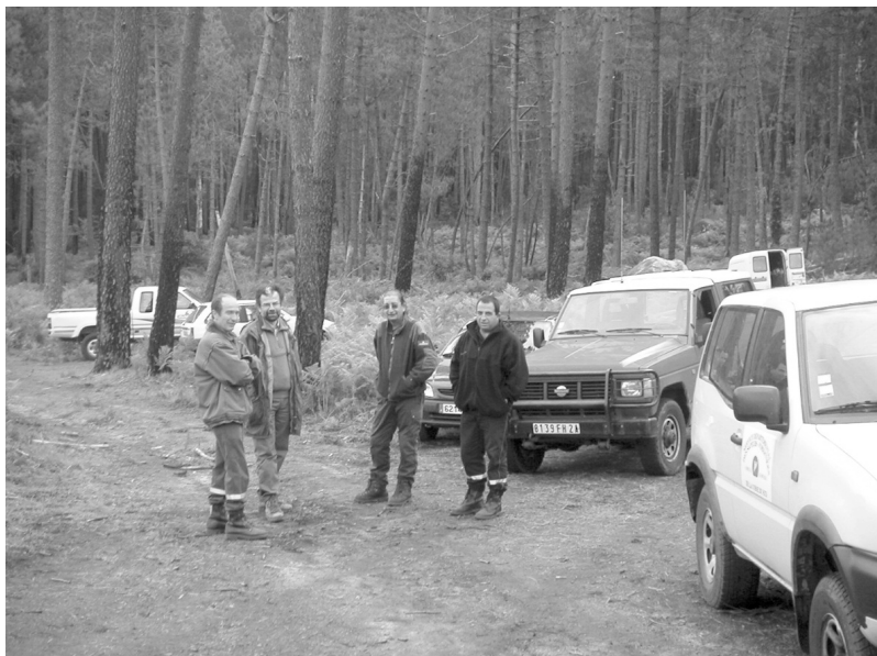
Photo 1 : Visite de terrain inter-services sur une LICAGIF en cours de réalisation.

Depuis l'élaboration du plan départemental en 1993, l'ensemble de ces intervenants a acquis une pratique de réflexion et d'actions inter-services.