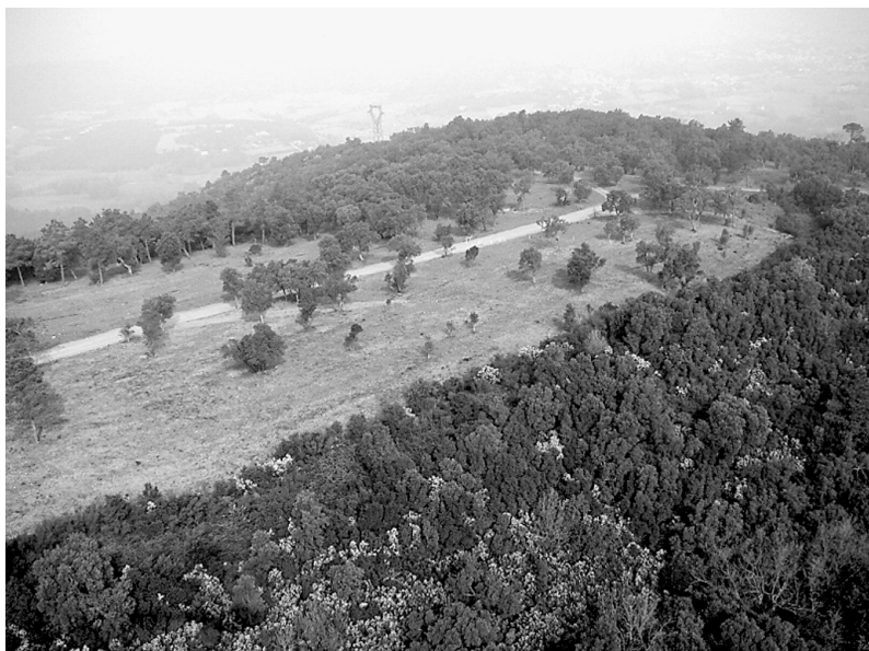
Photo 1 : Coupure de combustible stratégique dans le Massif des Maures

Lorsqu'une coupure de combustible est confrontée à un véritable incendie, l'opportunité doit être saisie pour analyser l'événement et en tirer tous les enseignements possibles. Cette approche est systématisée depuis quelques années par le Réseau Coupures de combustible (LAMBERT et al. , 1999). Des retours d'expérience sont actuellement organisés par les partenaires varois de ce réseau pour étudier le comportement au feu des coupures de combustible du massif des Maures touchées par les grands incendies de l'été 2003. Cette étude étant en cours, nous en donnerons les résultats dans un prochain article.