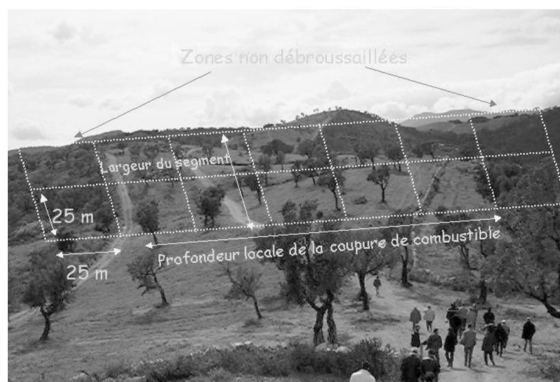
Fig. 1 : Description d'un segment sur la coupure de Marguaritaghju (Corse-du-Sud).

Ainsi la strate herbacée a été évaluée globalement sans distinguer les espèces. Mais les strates arbustive et arborée ont été évaluées, pour chacune de leurs classes de hauteur respectives, en distinguant à chaque fois les trois espèces dominantes, ainsi que la couche de végétation dans son ensemble.