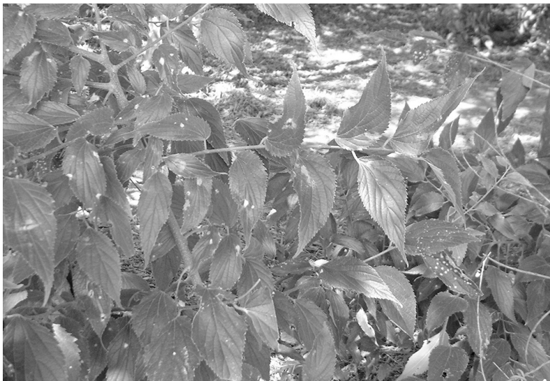
Photo 1 : Les feuilles dentelées, dissymétriques et en position alternée sur les rameaux rappellent que le micocoulier est un proche cousin des Ormes

Au XIX e siècle, certaines espèces habituellement plantées en milieu urbain (comme le peuplier) connaissent d'importants problèmes de dépérissement. Parallèlement, le besoin en plantations d'alignement dans les villes en pleine extension et sur le réseau routier en restructuration, grandit. Les aménagistes spéculent donc sur la (ou les) espèce(s) pouvant satisfaire à ces différents usages. Dans un premier temps, le micocoulier sera choisi dans les villes du sud de la France. Mais voilà que le platane introduit depuis peu donne lui aussi d'excellents résultats en croissance et en résistance. Il lui sera finalement préféré. Ce choix sera dénoncé ouvertement par de nombreux intellectuels et naturalistes provençaux de l'époque qui y voient un acte d'ingratitude envers une espèce qui avait tant apporté, autrefois, à