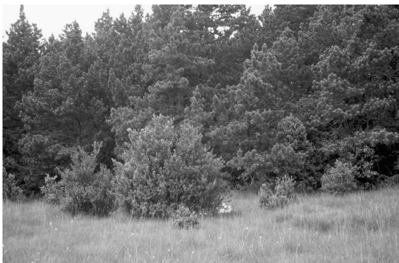
Photo 3 : En lisière de forêt, les buis colonisent la pelouse meso-xérophile à Brome érigé : exemple de régression spontanée d'un habitat protégé par la directive "habitats".

l'adéquation de l'outil phytosociologique pour analyser les hétérogénéités de la végétation.