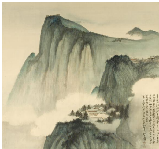
Fig. 3. Mont Emei , par Zhang Daqian, encre sur soie, Tokyo, 1955. Musée Cernuschi, Musée des arts de l'Aise, Paris.

Pour que la musique exprime la profondeur, il faut souvent inverser la rapidité et la lenteur de temps dans la douceur. La profondeur peut être remplie de sous-entendus 11 .