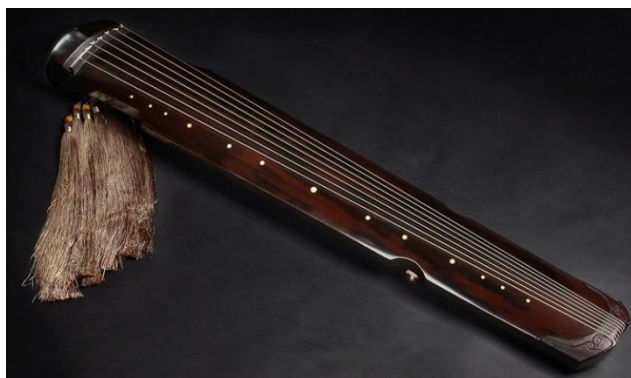
Fig. 2. Le Guqin, instrument traditionnel chinois. Reproduit in "Reliques culturelles et espace artistique de Fusheng", https://fushengart.wordpress.com , consulté le 2 juin 2021.

Ces quatre caractéristiques proviennent de la musique ancienne des intellectuels chinois qui croyaient que le Guqin avait des caractéristiques sonores similaires à la voix et ils utilisaient souvent la musique du Guqin pour exprimer l'état d'esprit de Qing.