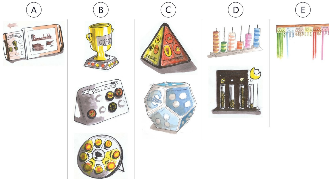
Figure 2: Différents objets physique représentant la progression de l'élève

L'appréhension du volume de l'objet invite à la manipulation et l'exploration active des différentes données représentées sur chaque face (voir Figure 3 pour exemple).