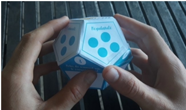
Figure 3: Objet directement manipulable par les élèves pour explorer la piste C présentée en partie 3

Au-delà de la question des données à physicaliser, les aspects dynamiques et interactifs de la physicalisation restent encore un challenge [7]. Il faudra notamment explorer comment connecter la physicalisation avec la plateforme numérique pour que les deux puissent s'alimenter l'un et l'autre, de manière à assurer une cohésion entre l'objet physique motivationnel qui incite l'élève à progresser, et l'activité d'apprentissage en ligne qu'il peut juger intrinsèquement peu motivante. Dans le contexte écologique de la classe, nous ne pouvons raisonnablement pas envisager des physicalisations complexes et coûteuses. La première piste envisagée serait d'intégrer à la plate-forme un système d'alerte qui indique à l'élève lorsqu'il a atteint un certain seuil de progression dans les compétences attendues, afin qu'il mette à jour lui-même son objet physique (par un système de gommettes ou autre). Cet objet physique pourrait être conçu à partir d'une imprimante 3D présente dans l'établissement scolaire (dans le temps de la classe), ses propriétés géométriques encodant les compétences finales à acquérir dans le programme d'enseignement, et qui seront ainsi également visibles à l'élève en dehors du temps de classe.