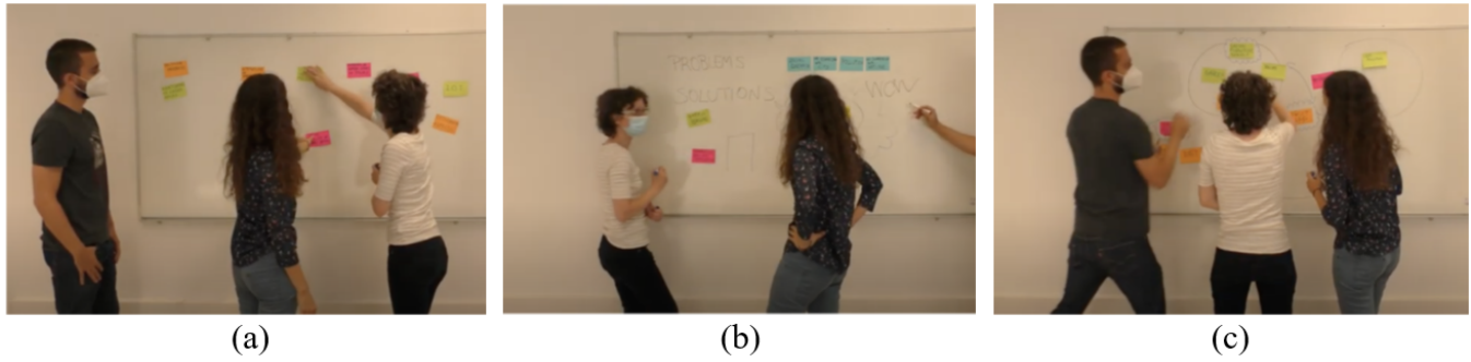
Figure 1: Les activités de l'équipe. (a) Répartition du Travail, (b) Partage des Idées, (c) Choisir une Idée.