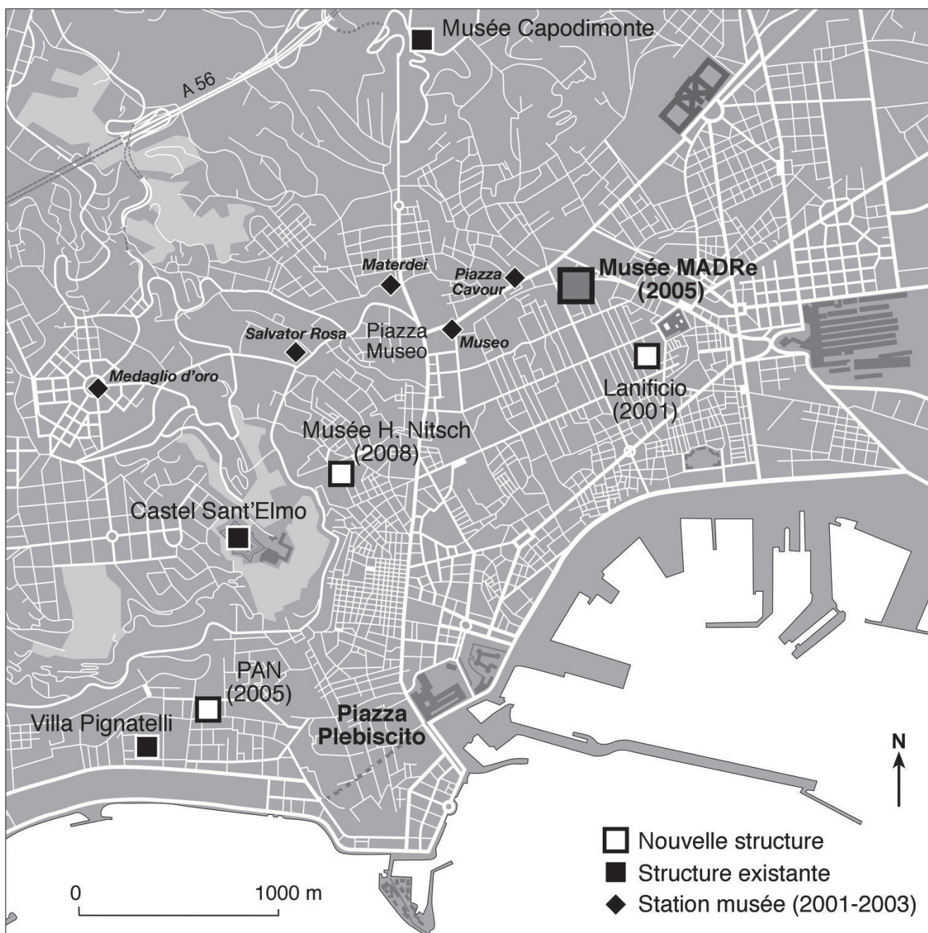
Fig. 1 - Principales structures et lieux liés à l'art contemporain.

Enfin, ces interrogations rejoignent celle des logiques des politiques de renouvellement urbain et de gouvernance à Naples, et de leur inflexion depuis le début du millénaire qui correspond aussi à une évolution du contexte politique et économique de la ville. On observe en effet un renversement de tendance depuis le moment de la « renaissance napolitaine », état de grâce qui court de 1993, date de l'élection d'Antonio Bassolino à la Mairie de Naples, à 1998, jusqu'à l'effritement de la confiance et au désarroi qui lui succèdent et trouvent leur acmé dans la récente crise des ordures en 2008. À cet égard, le MADre, symbolise aussi les crispations et les blocages croissants entre institutions et société civile et fait l'objet de contestations récurrentes.