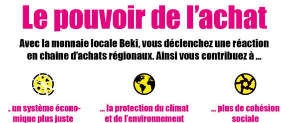
Figure 3 : le Beki