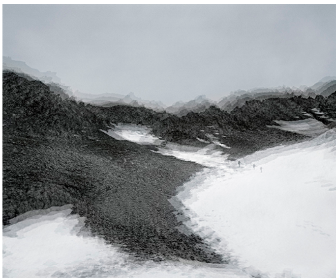
› Éric Bourret, Dans la gueule de l'espace , 2011. Tirage jet d'encre baryté HahnemAhle, 110 x 135 cm contrecollé sur dibond. Avec l'aimable autorisation de l'artiste.

Plutôt qu'un mixage des représentations, la superposition des plans dans son développement en épaisseur produit une texture montagnaise prise dans un inachèvement permanent et emportent le spectateur dans son sillage. Les images d'Éric Bourret invitent à percevoir que l'espace n'est pas réductible à une simple addition de phénomènes sensibles dont l'expérience serait faire successivement, de même que la durée vécue ne se réduit pas aux coups d'horloge se succédant dans un enchaînement numérique. L'ensemble des phénomènes avec lesquels l'être interagit forme un tout in situ , une ambiance, une atmosphère. Ainsi, pour celui qui est distrait, les coups d'horloge se fondent dans une multiplicité non numérique, qualitative, de fusion, d'interpénétration. La répétition génère un phénomène hypnotique par engourdissement des zones superficielles de la conscience et entraîne par là même une écoute de la durée pure. Ainsi, les montagnes photographiées par Éric Bourret, loin d'être mutilées par une vision séparatrice et abstraite du monde, restituent la matière dans la mélodie immanente au rythme vital que constitue la pure durée bergsonienne.