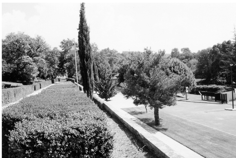
Photo 7 (ci-dessus) : Les espaces verts à l'entrée du domaine

Le budget de l'Entente pour l'an 2002 s'établit aux environs de 3,2 millions d'euros (21 MF) dont 960 000 euros (6,3 MF) de cotisations des départements, le reste étant constitué par des subventions de l'Etat (Ministère de l'intérieur et Conservatoire de la forêt méditerranéenne), de la Région P.A.C.A., de l'Union européenne et divers.