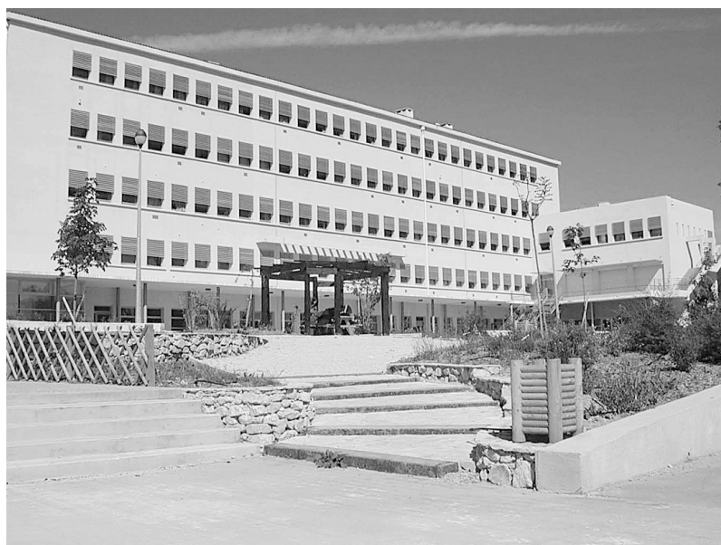
Photo 3 (ci-dessus) : Le Lycée agricole de Valabre

- le Brevet de technicien agricole (B.T.A.) «Service en milieu rural» forme des techniciens agricoles qualifiés,