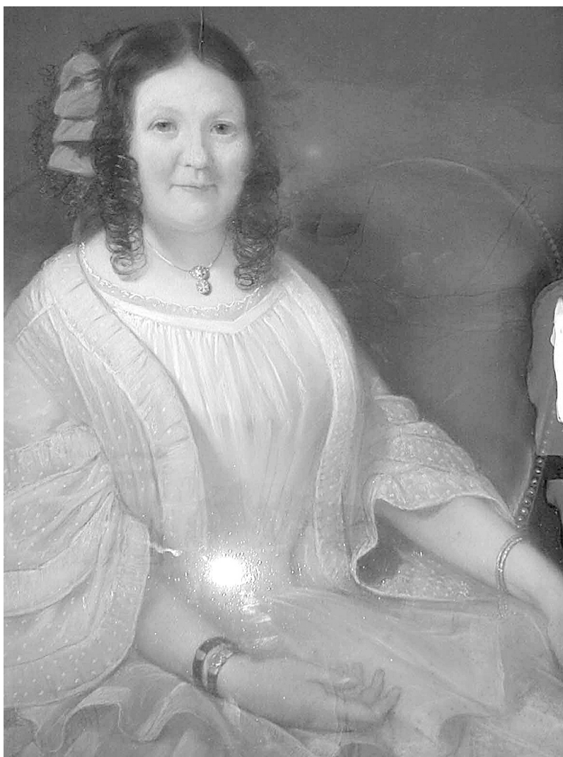
Photo 2 (ci-dessus) : Reproduction du portrait de La Marquise de Gueidan