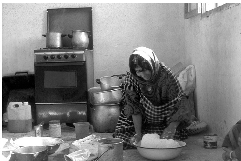
Image de la transition énergétique à El Faouar : préparation traditionnelle du pain et équipement domestique moderne