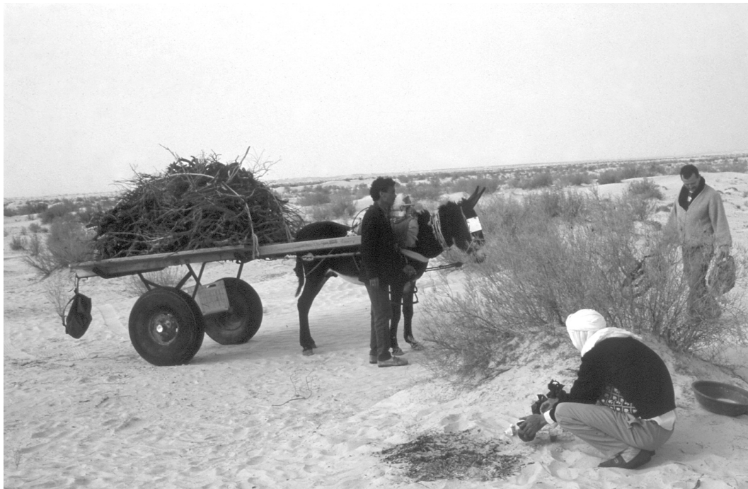
Photo 1 : Récolte de combustible dans la steppe (El Faouar)

Bien que la consommation per capita soit plus faible en ville, le milieu urbain avec 81,4 % de ménages utilisateurs, représente plus de 60 % de la demande nationale de charbon de bois (Cf. Tab. II). Le charbon est utilisé principalement pour la préparation du thé, mais aussi pour le chauffage et les grillades... La demande nationale est évaluée à environ 160 000 tonnes par an, soit un équivalent en bois primaire de l'ordre de 800 000 tonnes 13 . Contrairement au bois de feu, le charbon transite par des filières commerciales, en milieu rural et urbain.