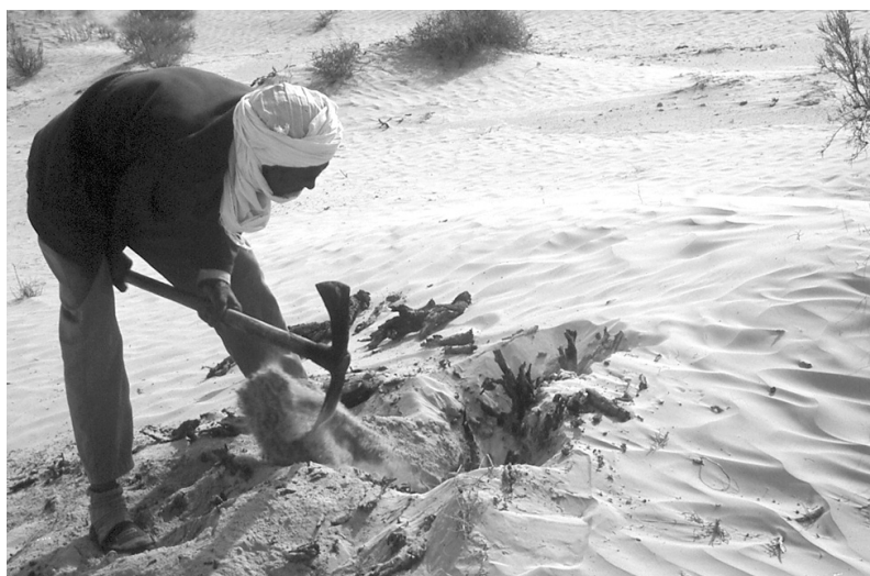
Photo 9 : Dessouchage de Limoniastrum guiyonianum à El Faouar pour l'approvisionnement domestique Photo L.A.

La stratégie forestière nationale n'est qu'une composante de l'intervention de l'Etat en milieu rural. Il s'agit pour l'Etat, non seulement de protéger les forêts mais aussi de contenir l'exode rural, et donc de maintenir dans les campagnes une population nombreuse fortement dépendante des ressources