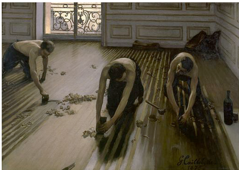
Gustave Caillebotte, Les raboteurs de parquet , 1875, Musée d'Orsay