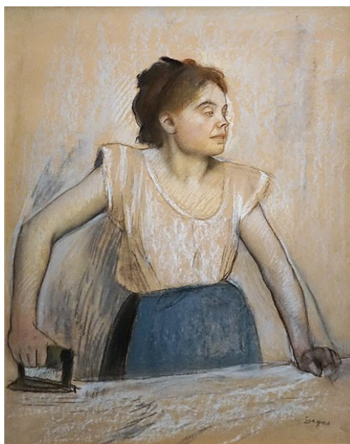
Edgar Degas, La repasseuse , v. 1869, Paris, Musée d'Orsay

Si le travail nous occupe de façon moindre qu'hier, sa centralité dans nos vies demeure, car il structure l'économie et la société. C'est une institution. Le travail occupe une place centrale dans la production (économique) et dans l'organisation de la société (sociologique). Il est politique, car il est source de