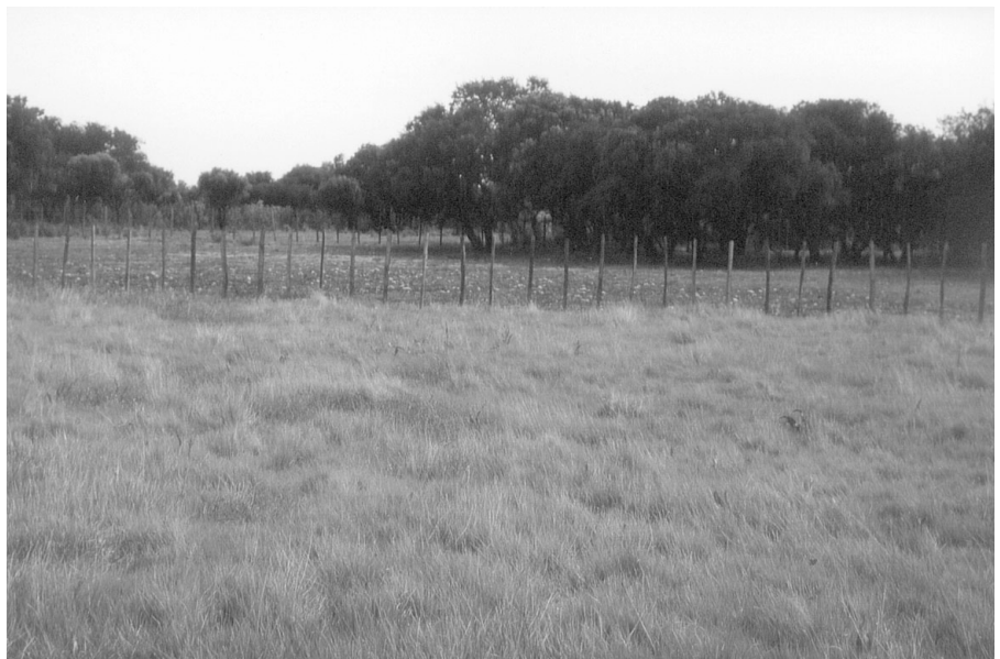
Photo 1 : Acquis par le CEEP, ce site abrite la seule station mondiale d'une petite germandrée, le teucrium de Crau

rain sur la commune de Mérindol dans le Vaucluse qui abrite la dernière station française connue de Garidelle fausse nigelle, une petite plante messicole ; acheté par le CEEP sur une indication du Conservatoire botanique de