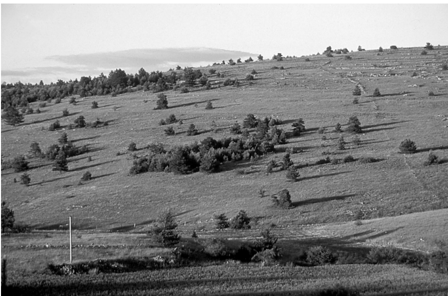
Photo 1 : Progression du pin sylvestre. Les individus qui se sont installés en premier sur la pelouse donnent naissance, à la génération suivante, à de petits bosquets.

Causse et sous la corniche orientale ainsi que par quelques arbres au lieu-dit La Fageole) pourrait s'installer massivement dans les boisements de pins situés à proximité des semenciers (DUFOUR 2000). Il est aujourd'hui difficile de prévoir le futur forestier des Causses mais il n'est pas impossible que PRIOTON (1972) ait vu juste et que le Hêtre soit amené à occuper une large place sur les causses.