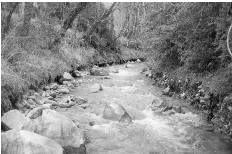
Photo 1 : Mise en place progressive d'un pavage à blocs liée à l'enfoncement du lit (Ruisseau de la Bine, décembre 1996).

Le tarissement des entrées sédimentaires en provenance des versants s'explique principalement par la forte colonisation végétale enregistrée sur les versants (TAILLEFUMIER, sous presse). Cette colonisation spontanée est consécutive de l'abandon des terrains par la communauté rurale qui a fortement diminué depuis la fin de la seconde guerre mondiale. De nombreux travaux ont en effet démontré que l'augmentation de la couverture