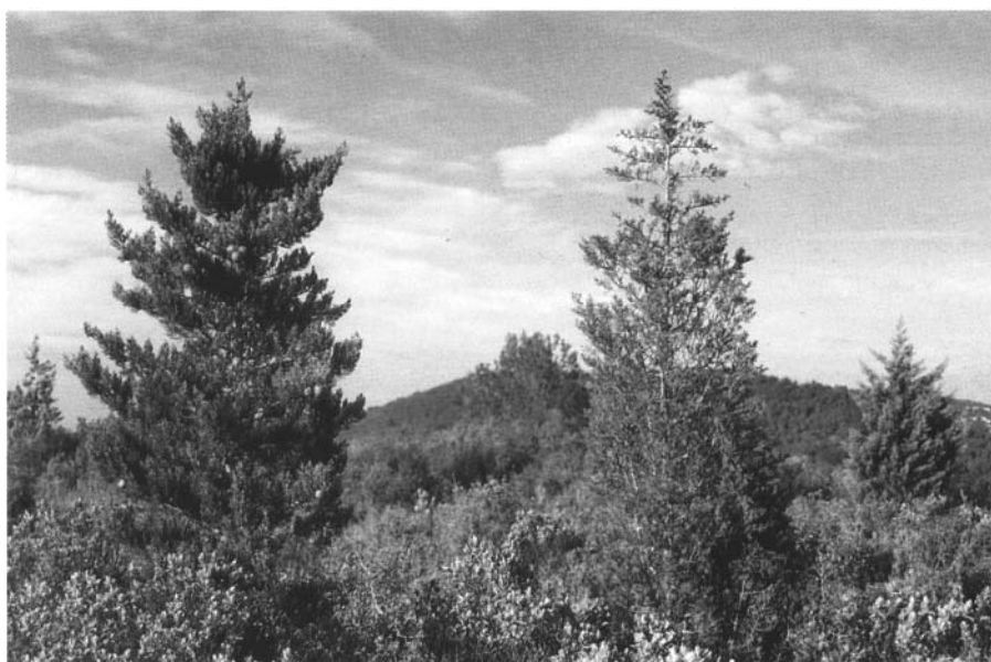
Photo 1 : La variabilité des individus : une origine génétique et des effets du milieu. Plantation comparative pour la résistance du cyprès vert au chancre coloré à Vitrolles (Bouches-du-Rhône)

La démarche scientifique développée par les généticiens forestiers consiste à établir un protocole expérimental qui permette de donner une