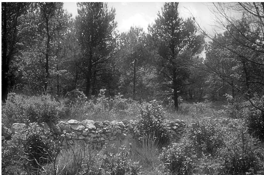
Photo 5 : Pinède sur terrasse anciennement cultivée (sol colluvial)

- Au deuxième niveau , les facteurs discriminants sont d'ordre climatique (altitude et distance à la mer). Ils se traduisent par des contraintes ther-