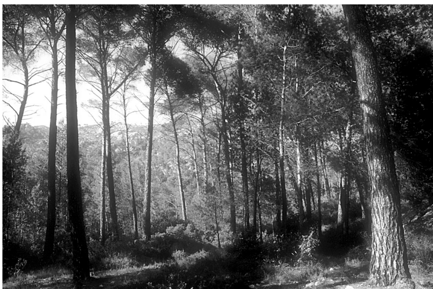
Photo 1 : Belle futaie de pin d'Alep à Super Gémenos (Bouches-du-Rhône)

Le pin d'Alep est un des arbres les plus communs sur le pourtour méditerranéen (il occupe 3,5 millions d'hectares selon LE HOUEROU cité par QUÉZEL en 1985). Il est présent sur la quasi-totalité du territoire de la Provence (hors zone de montagne) où il est aussi appelé pin blanc. Il paraît s'adapter à toutes les conditions écologiques, même les plus contraignantes. C'est, avec le pin sylvestre, le résineux