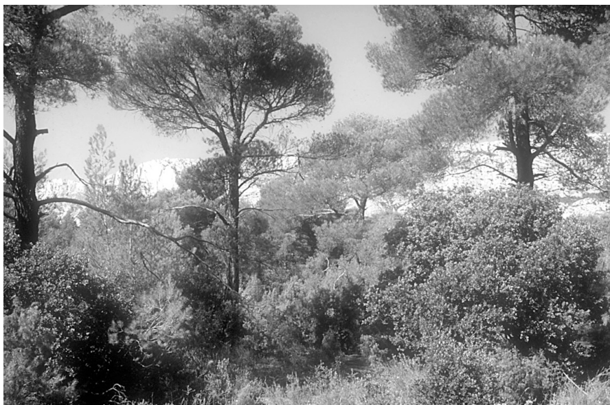
Photo 2 : Pinède claire avec sous-étage de chêne vert, sur le plateau du Cengle (Bouches-du-Rhône)

Cette modélisation diffère de celles qui ont été proposées jusqu'à présent. Le modèle créé est seulement valable au niveau d'un arbre (indice arbre), et