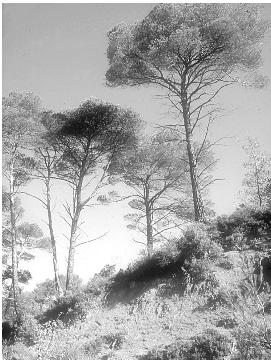
Photo 4 : Pin d'Alep sur argilite - Sainte Victoire (Bouches-du-Rhône)