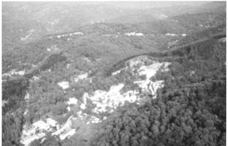
Photo 1 : Le feu de l'Etoile au nord de Marseille, on peut remarquer les sautes de feu.

Ce dernier point ne dément pas les pronostics formulés depuis quelques années, et ne peut que conduire à maintenir une vigilance rigoureuse.