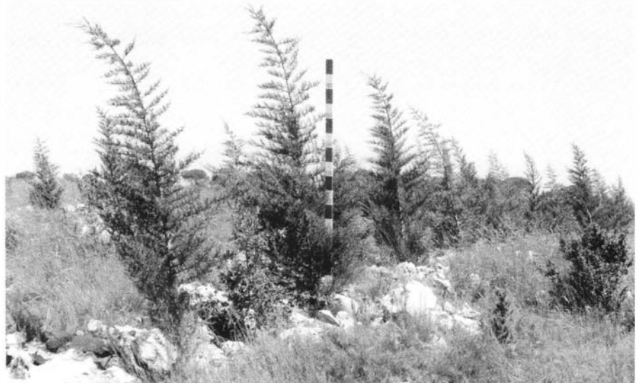
Photo 1 : Sylvetum de Clos-Gaillard - Cyprés méditerranéens, forme étalée, plantation octobre 1993

Le pin de Salzman ( Pinus clusiana Clem.), grâce à son écorce épaisse et isolante, résiste depuis des siècles à des incendies répétés sur les dolomies de Saint-Guilhem-le-Désert, dans un milieu proche de nos garrigues à bien des égards, et au moins aussi ingrat qu'elles. Il est, en Espagne, le plus apprécié des pins noirs, à la fois pour son port, sa régularité de croissance en milieu difficile et la qualité de son bois. Essence de lumière, il ferme mal le couvert, mais peut être entretenu à moindres frais par la pratique des feux contrôlés.