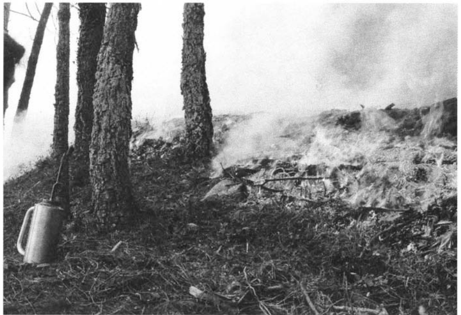
Photo 1 : Démonstration de brûlage dirigé à la Garde Freinet (83) en 1993