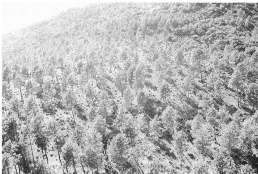
Photo 5 : Coupure de combustible dans une pinède après éclaircie, broyage des broussailles et rémanents, et brûlage dirigé - Gagnol - La Garde Freinet (83)

Dans un avenir immédiat, les efforts du SIVOM du Pays des Maures et du Golfe de St-Tropez consisteront surtout à conforter les acquis tout en pré-