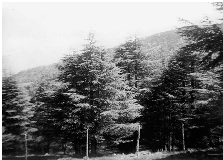
Photo 2 : Futaie jeune de Cèdre sur le versant NW du massif de Bélezma

L'accroissement moyen en volume calculé dans les placettes à l'âge de référence 100 ans, varie de 0,66 m^3/ha/an dans les peuplements des classes de croissance faible à 4,08 m^3/ha/an dans les bonnes stations.