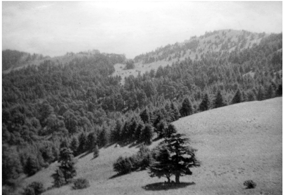
Photo 1: Peuplements de Cèdre de l'Atlas dans le massif de Bélezma

Les sols sont de type brun calcaire et rendzines se développant sur pentes fortes.