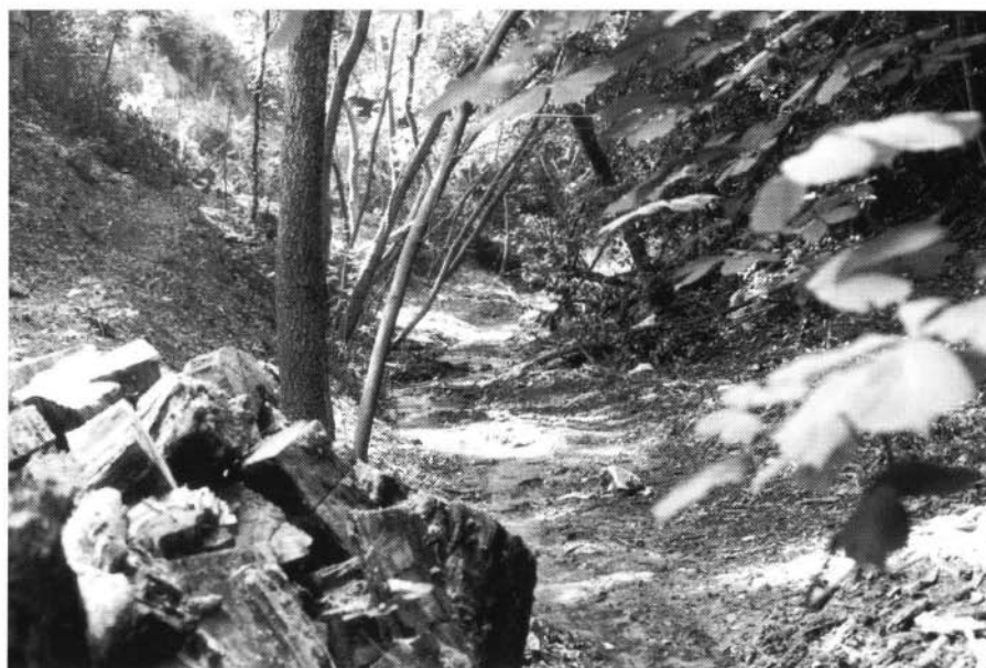
Photos 3 et 4 : Le gaudre qui jouxte la propriété, avant (en haut) et après (en bas) l'intervention de la F.I.R.A.