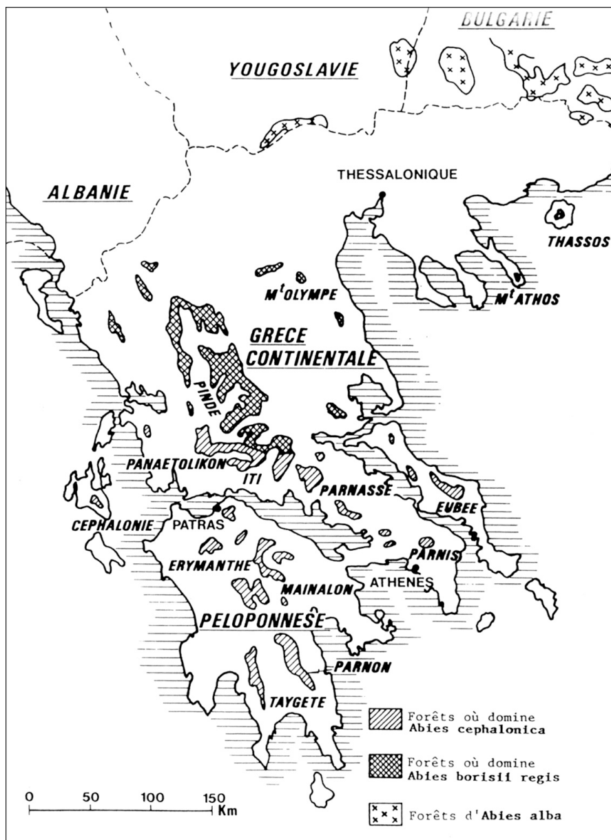
Fig. 1 : Aire de répartition des principales formations de sapins en Grèce

En marge de ce réseau, un réseau comparatif d'hybrides interspécifiques a été installé. Il se compose à l'heure actuelle d'un seul site expérimental : Le Bois Génard (Haute Marne), le site de la Forêt du Dom (Var) ayant malheureusement brûlé en 1989. Dans ce site, 4 descendances hybrides ayant Abies nordmanniana pour mère sont comparées à 7 descendances d'arboretum de sapins méditerranéens : Abies alba (1 descendance), A. nordmanniana (4 descendances), A. cephalonica (1 descendance), A. pinsapo (1 descendance) et A. numidica (1 descendance), pour un total de 680 plants expérimentaux.