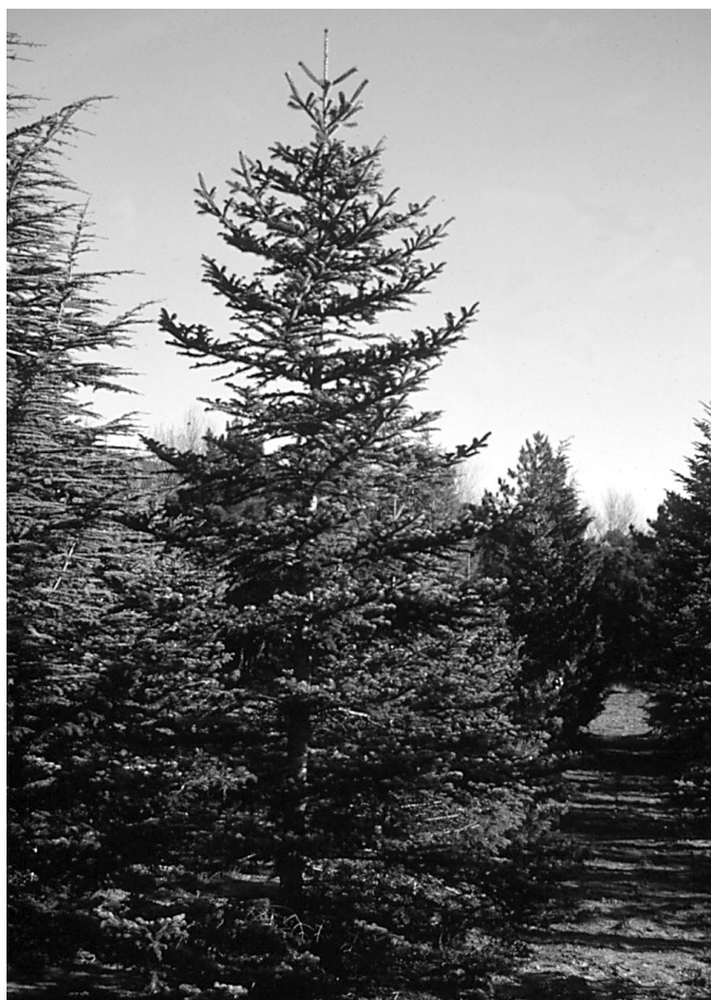
Photo 2 : Sapin de Bornmuller, plantation conservatoire INRA du Ruscas