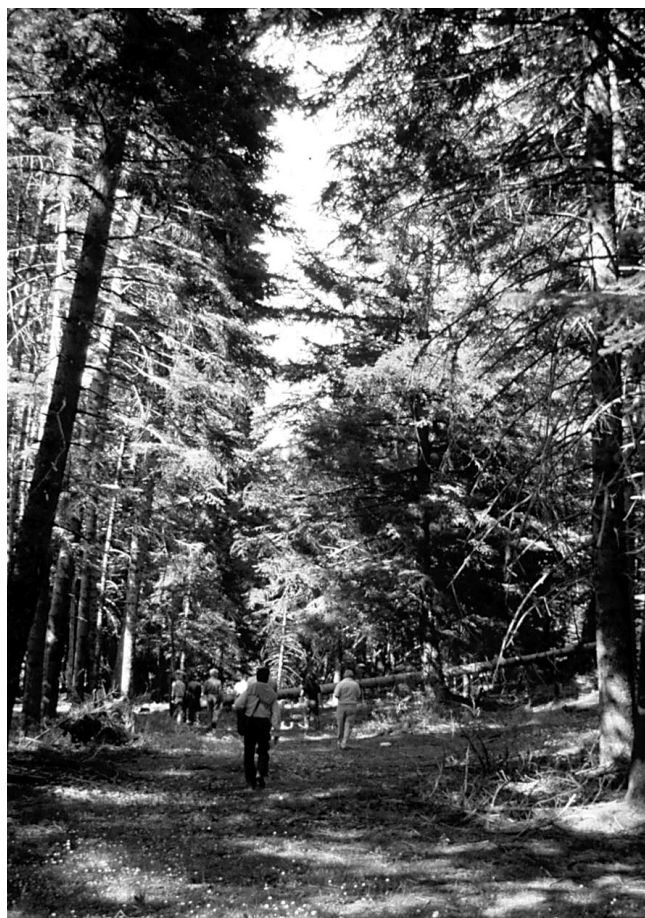
Photo 3 : Sous-bois de la forêt de sapin de Céphalonie de Vetina, Mainalon, Grèce