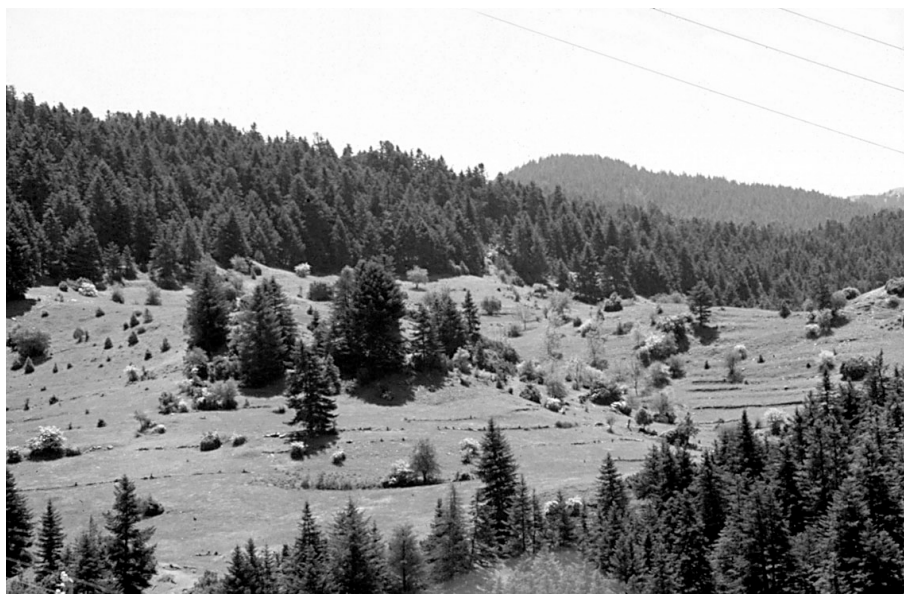
Photo 1 : Vue d'ensemble de la forêt de sapin de Céphalonie de Vetina, Mainalon, Grèce

La plasticité écologique de cette espèce décrite par plusieurs auteurs (voir par exemple PAULY, 1962 et BARBÉRO et QUÉZEL, 1976) a suscité l'intérêt des chercheurs forestiers. Un réseau expérimental a ainsi été installé dans le but d'estimer la diversité et l'adaptabilité de l'espèce au milieu méditerranéen français.