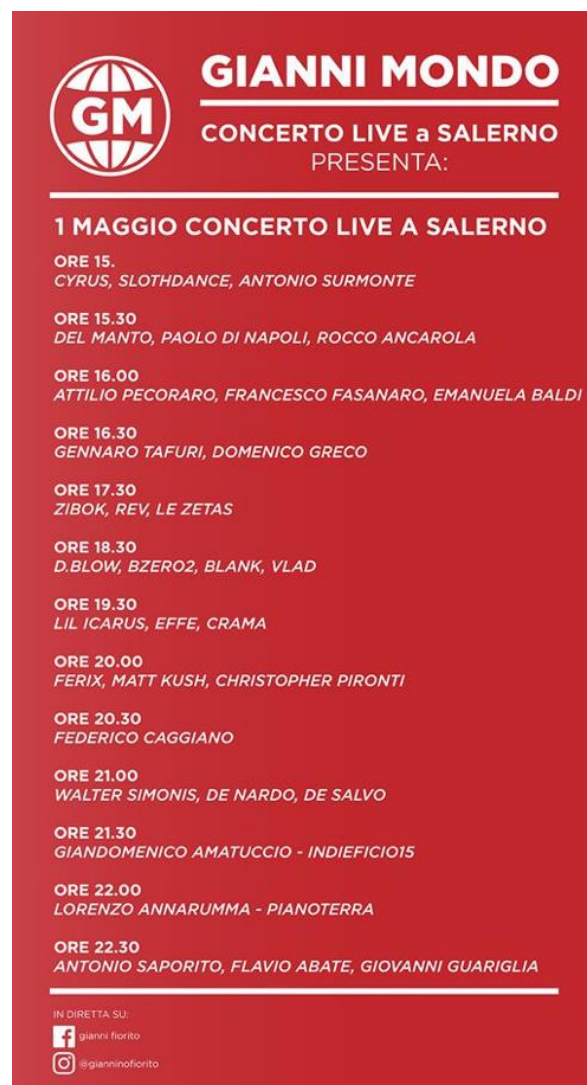
Fig. 4 : Programmation du concert du 1 er mai 2020 du Giannimondo , proposée sur les réseaux sociaux.

La publicité de l'évènement a adopté des stratégies très directes, empruntées des enjeux de communication propres aux médias comme la télé ou la radio. En effet, Gianni, les co-présentateurs et quelques-uns des artistes invités ont réalisé un spot publicitaire en très peu de temps. 11 Cela a permis de diffuser la nouvelle du concert très rapidement, toujours à travers les réseaux sociaux.