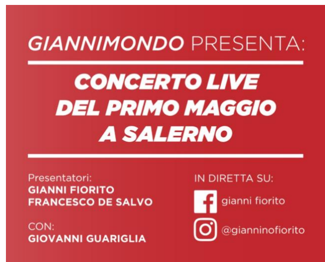
Fig. 3 : Affiche publicitaire du concert du 1 er mai 2020 du Giannimondo , proposée sur les réseaux sociaux.

L'événement le plus important organisé à l'intérieur du Giannimondo a été le concert du 1 er Mai 2020, 9 qui a vu dix heures de performances d'environ trente jeunes artistes en livestreaming (voir Fig. 3).