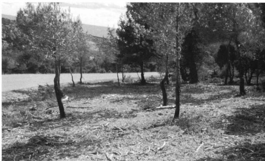
Photo 4 : Lit de broyat sous pin d'Alep après ouverture - Sénanque (84).