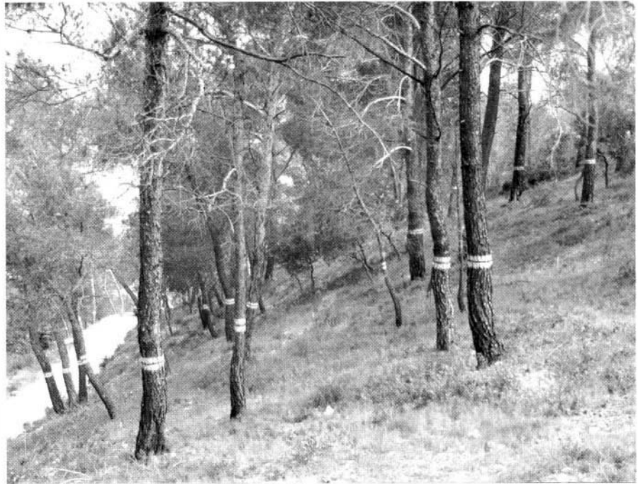
Photo 2 : Coupure dans pin d'Alep à la Roque d'Anthéron, 1 an après le débroussaillage.

Certaines de ces coupures ont une vocation stratégique, à ce titre leur implantation doit être réfléchie par les services forestiers, en concertation avec les services de lutte, afin que leurs caractéristiques (site, orientation, largeur, niveau d'entretien, ...) les rendent opérationnelles en phase de lutte. La réalisation de ces ouvrages doit tenir compte d'autres contraintes liées à la nature des peuplements à protéger, au relief souvent chahuté et à l'accessibilité du site. Pour être opérationnelles, ces coupures doivent être desservies par des pistes carrossables et assurant elles aussi, une certaine sécurité aux équipes de lutte. Le réseau de chemins préexistants qui desservait des exploitations agricoles ou liait des hameaux entre eux, est souvent dense mais mal adapté aux caractéristiques actuelles des véhicules (largeur, pentes en long et en travers). Il a dû être aménagé pour être intégré dans ce maillage. De nom-