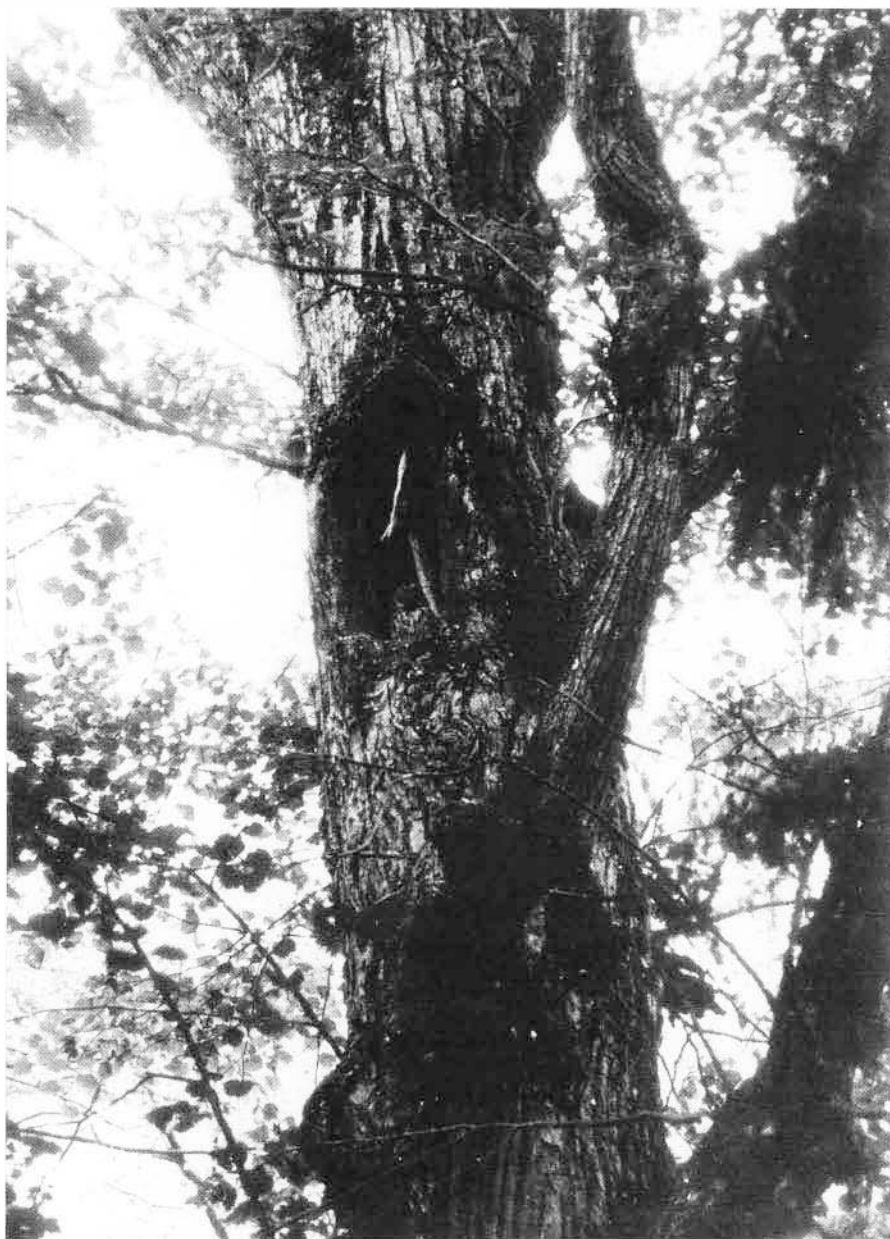
Photo 1 : Les arbres creux sont nécessaires à de nombreuses espèces. Cette chouette hulotte niche tous les ans dans ce vieux Tilleul.

2.- la complexité de la structure verticale : la hauteur moyenne de la canopée est très élevée, de l'ordre de 30 à 40 m, percée de loin en loin par des arbres géants vieux de plusieurs siècles. Ces "émergents" sont ancrés au sol par des piliers en arc-boutants qui se prolongent insensiblement dans le système racinaire, comme dans les forêts tropicales dont les forêts tempérées ne sont, au plan des types morpho-structuraux, qu'un épiphénomène (HALLÉ, comm. pers. ). Ses cinq à six étages bien individualisés de végétation sont structurés par la démographie. Si l'on trace la courbe de la densité des arbres en fonction d'intervalles égaux de classes de diamètre de leurs troncs, le nombre de tiges rencontrées dans chaque intervalle est une fraction constante de celui qu'on rencontre dans l'intervalle de taille suivant, ce qui se traduit par une diminution exponentielle du nombre de tiges à mesure que la taille des arbres augmente (MEYER 1952). Associée à la