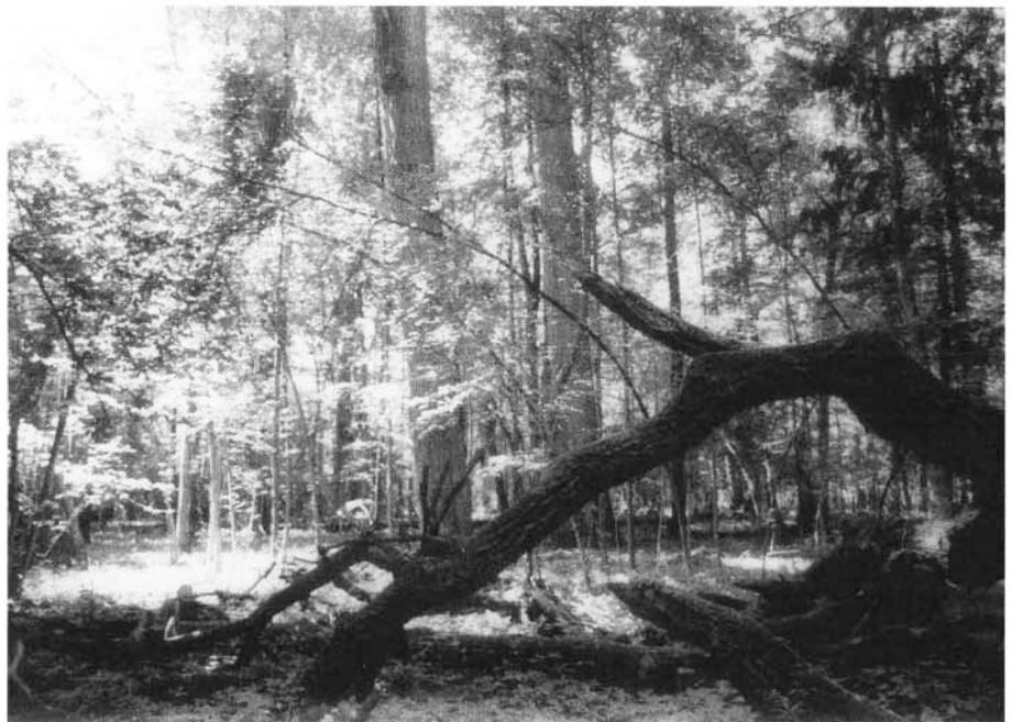
Photo 2 : La forêt naturelle est toujours très hétérogène : bois mort sur pied ou à terre, vieux arbres, jeunes tiges. Elle n'est ni un amas de broussailles impénétrables ni une cathédrale dont les colonnes se répètent à l'infini. Cette diversité de structure garantit la biodiversité du système dans son ensemble (forêt à caractère primaire de Bialowieza).

comprend les chablis qui ouvrent des clairs dans la forêt et entretiennent une hétérogénéité topographique à petite échelle comme on vient de le voir. La deuxième catégorie englobe un ensemble complexe et très divers de perturbations d'origine animale, par exemple les attaques d'insectes ou de champignons qui affaiblissent ou tuent les arbres, mais surtout l'action de ces "ingénieurs" écologiques comme on les appelle parfois (JONES et al. 1994) que sont beaucoup d'animaux. Les travaux de génie forestier réalisés par les Castors créent des habitats nouveaux