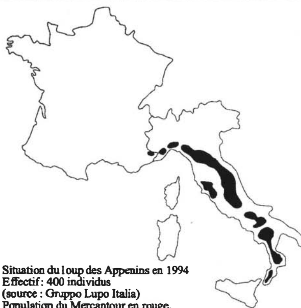
Situation du loup des Apennins en 1994 Effectif : 400 individus Population du Mercantour en rouge.