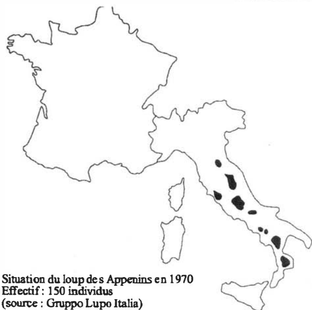
Situation du loup des Apennins en 1970 Effectif : 150 individus (source : Gruppo Lupo Italia)