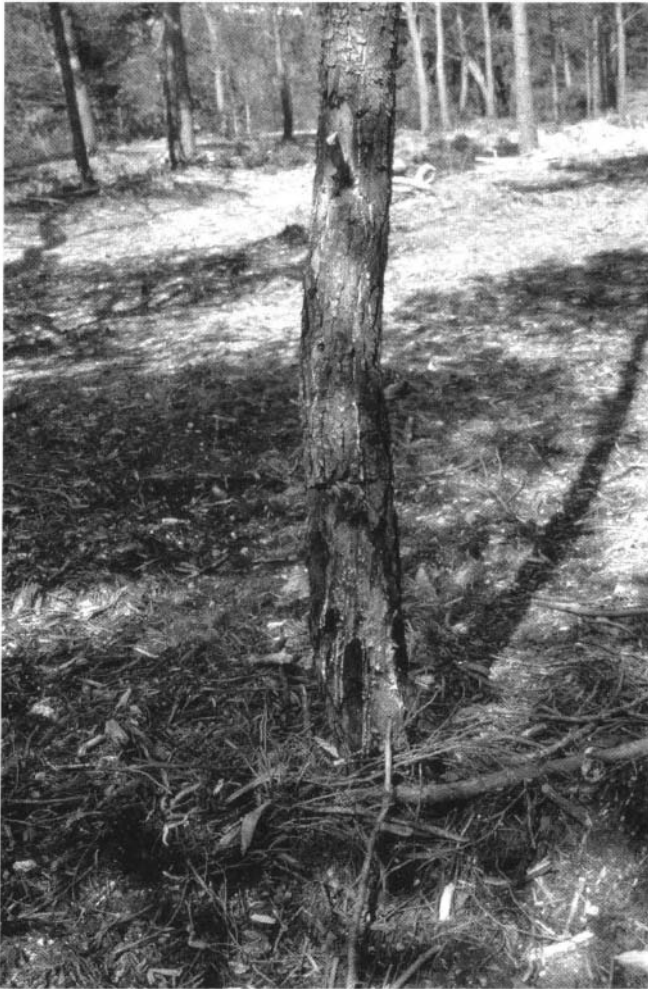
Photo 1 : Blessures au collet dues à un engin de débroussaillage.