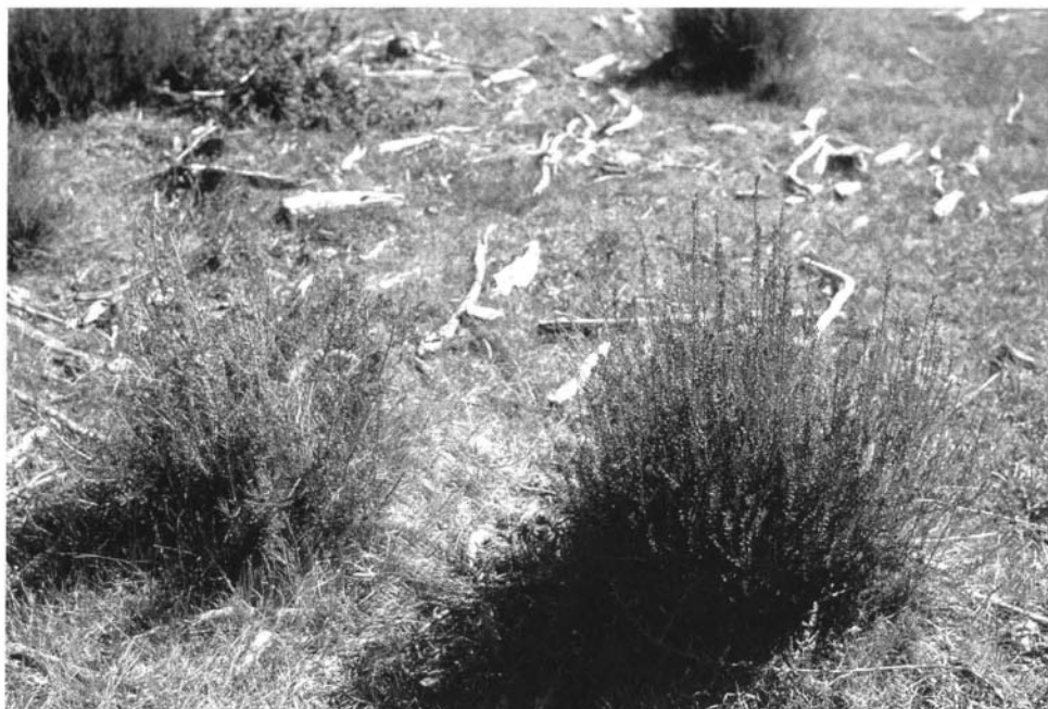
Photo 3 : Consommation sélective de la bruyère arborescente (à gauche). La bruyère à balais n'est pas touchée.

Tab. VI (ci-contre) : Coûts (FHT/ha) retenus pour l'élaboration du prix de revient de l'entretien des coupures de combustible (cas d'une forêt des Maures)