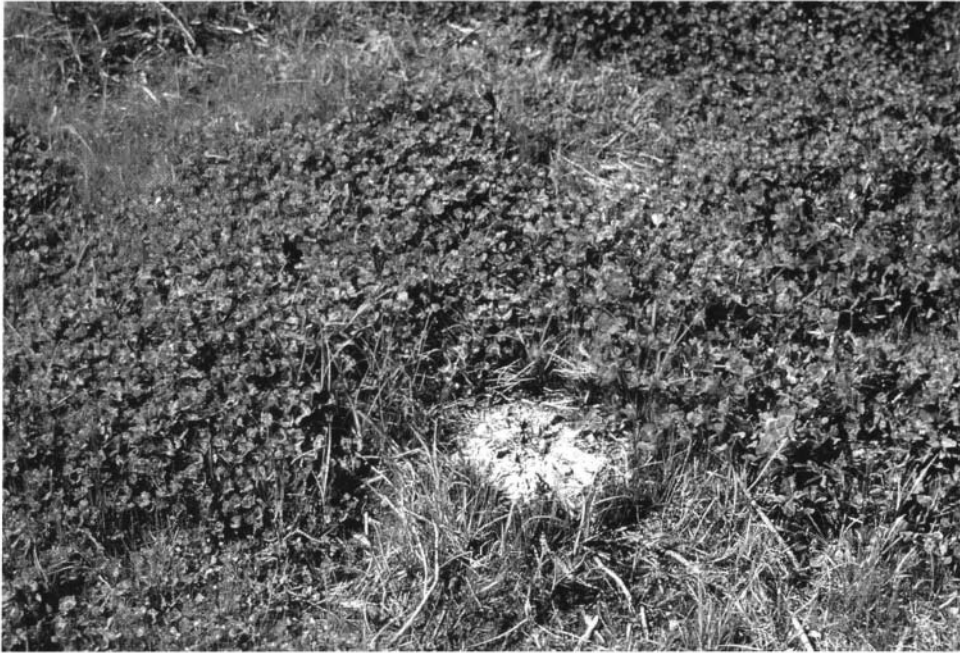
Photo 5 : Etouffement d'une souche à bruyère arborescente par un sursemis de trèfle souterrain.