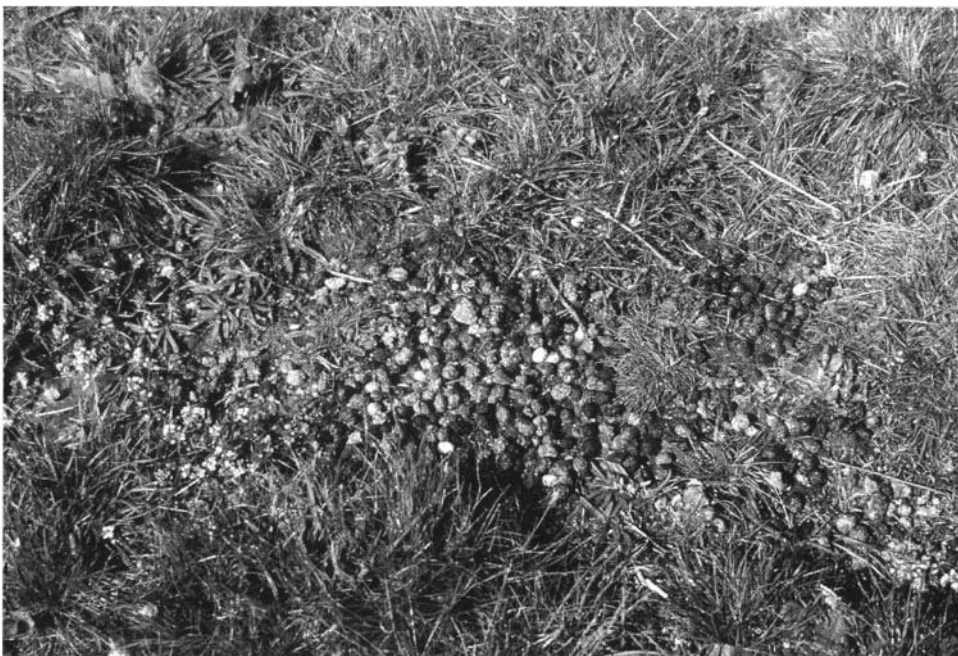
Photo 2 : Les sursemis attirent également les lièvres...

5 - L'EFFICACITÉ ÉCONOMIQUE mesure le coût moyen global d'un scénario (Coût10) estimé sur la base de l'ensemble des interventions ayant participé à l'aménagement et avec le plus de recul possible (amortissement sur 5 voire 10 ans).