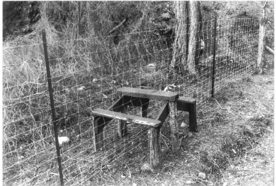
Photo 1 : Clôture et franchissement de clôture : exemple de passage d'homme.

- portes à fermeture automatique, chicanes ou "passages d'hommes", échelles et enjambements, passages pour V.T.T.