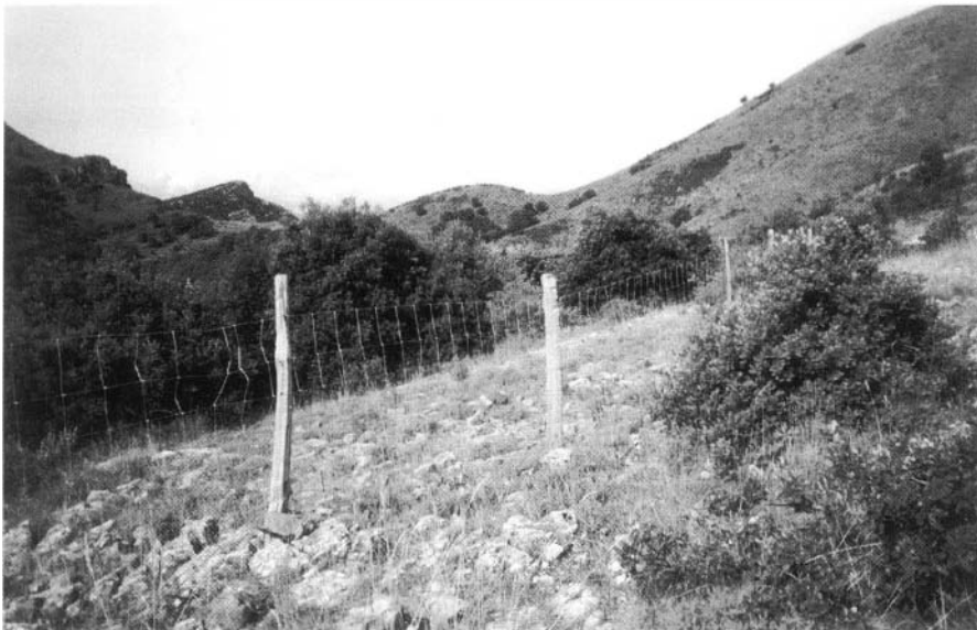
Photo 2 : Clôture et gestion en parcs pour ovins : entretien des coupures stratégiques pastorales ( Gard - Sumène - Cévennes méridionales - secteur d'application d'une opération locale ou "article 19 et pâturage D.F.C.I.).

Les personnes qui vont se promener en forêt et qui se retrouvent face à des troupeaux de bovins en espace clôturé ne comprennent pas obligatoirement ce qu'elles voient. Cette réaction est due à l'image que le touriste a de la forêt. C'est pourquoi il est nécessaire, et nous l'avons déjà souligné,