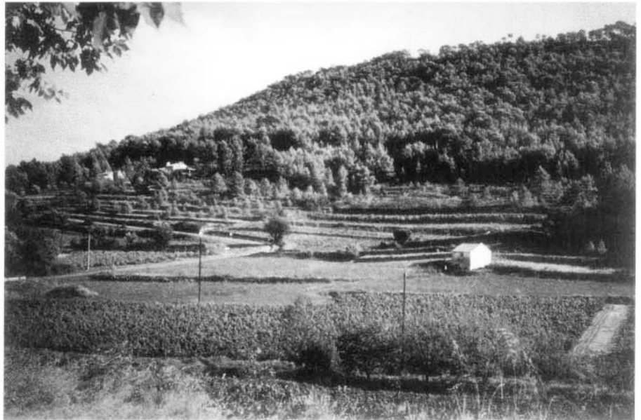
Photo 2 : Recolonisation d'anciennes cultures par le pin d'Alep en Provence littorale, aux environs de Toulon.

** des peuplements mélangés de Pins et Genévriers (oxycèdre, commun, rouge), qui maintiennent leurs caractéristiques structuro-architecturales durant plusieurs décennies. Ce sont les "Trevadis" provençaux, lieux