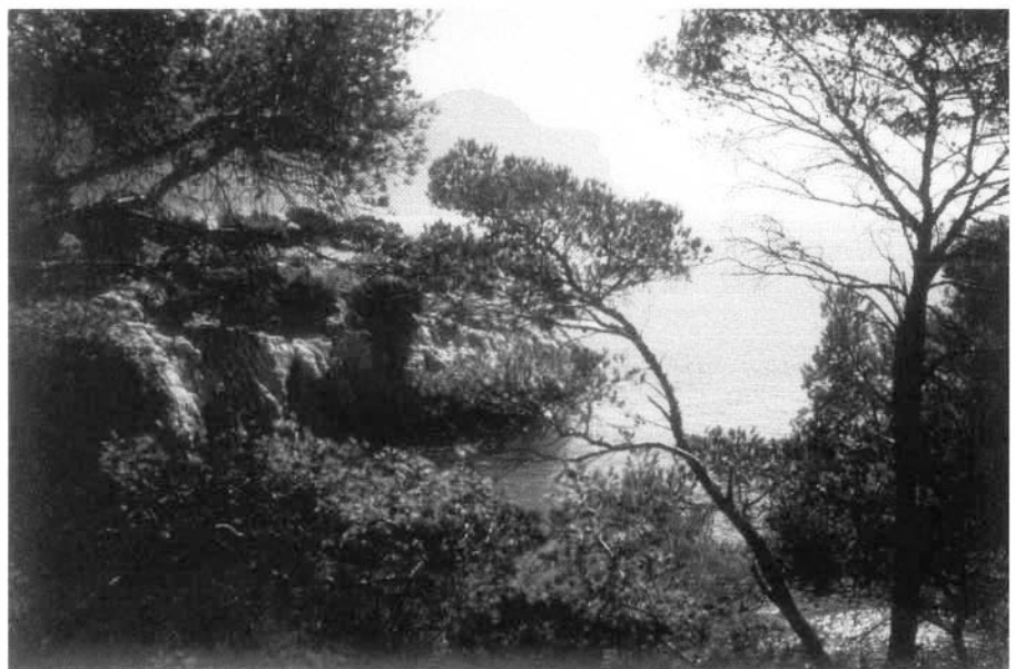
Photo 1 : Peuplement thermoméditerranéen naturel dans les Calanques de Cassis, en position littorale et sur calcaires compacts.

- colonisation par le Pin d'Alep des taillis sclérophylles de faibles recouvrements ayant servi de parcours,