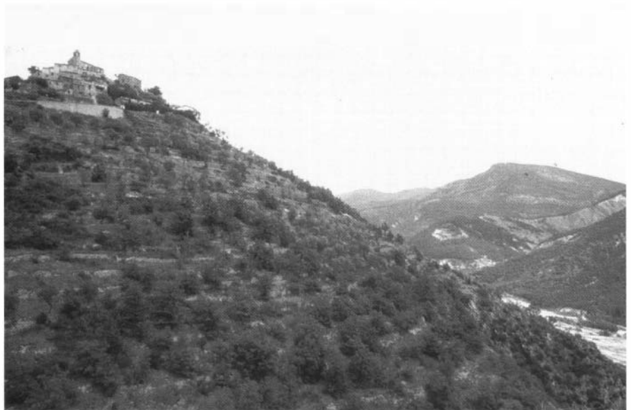
Photo 3 : Envahissement d'anciennes terrasses cultivées en oliviers par le pin d'Alep à Castellet-les-Sausses (Alpes-de-Haute-Provence).