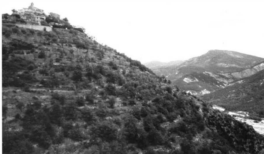
Photo 3 : Castellet-les-Sausses (Alpes de Haute Provence) - Le piton rocheux qui supporte le village, autrefois cultivé en oliviers, est totalement en friche; la présence du village en devient incongrue! Il faut traverser un désert pour atteindre les habitations.