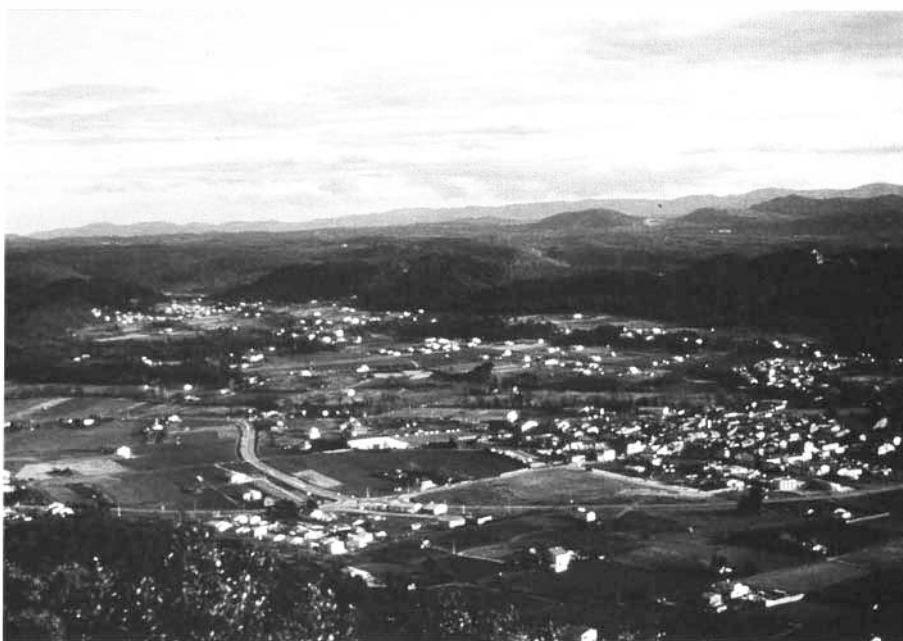
Photo 5 : Le Val (Var) - La dispersion de l'habitat homogénéise et banalise l'espace rural au point de rendre incompréhensible les logiques de son organisation.

Le rejet de paysages "repoussoirs", paysages trop urbanisés, le malaise éprouvé devant l'extension des friches agricoles, sont autant de signes d'une vision de citadins, frisant la schizophrénie sociale (terme employé par certains d'entre nous ! Nous refusons les paysages que nous contribuons à produire !) et alimentant une pression, une demande de "faire" des beaux paysages.