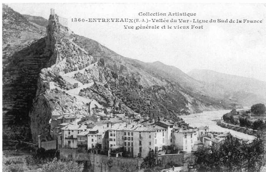
Photo 1 : Le site d'Entrevaux (Alpes de Haute Provence) - Son caractère exceptionnel (parfaitement identitaire) et une claire lisibilité des différents usages du sol : l'agglomération, le rocher et la citadelle, les vergers d'oliviers en terrasses et, plus haut, l'espace pastoral (aujourd'hui forestier) font que sa qualité est unanimement appréciée depuis longtemps.

Carte postale du début du siècle