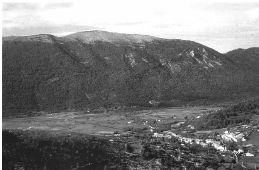
Photo 4 : Solheilhas (Alpes de Haute Provence) - Les tendances de l'évolution de ce beau paysage de montagne sont déjà perceptibles ici : la baisse de l'activité agricole apparaît par les friches et la limite floue entre l'espace forestier et l'espace agricole. D'autre part le mitage des abords du village en trouble la lisibilité..