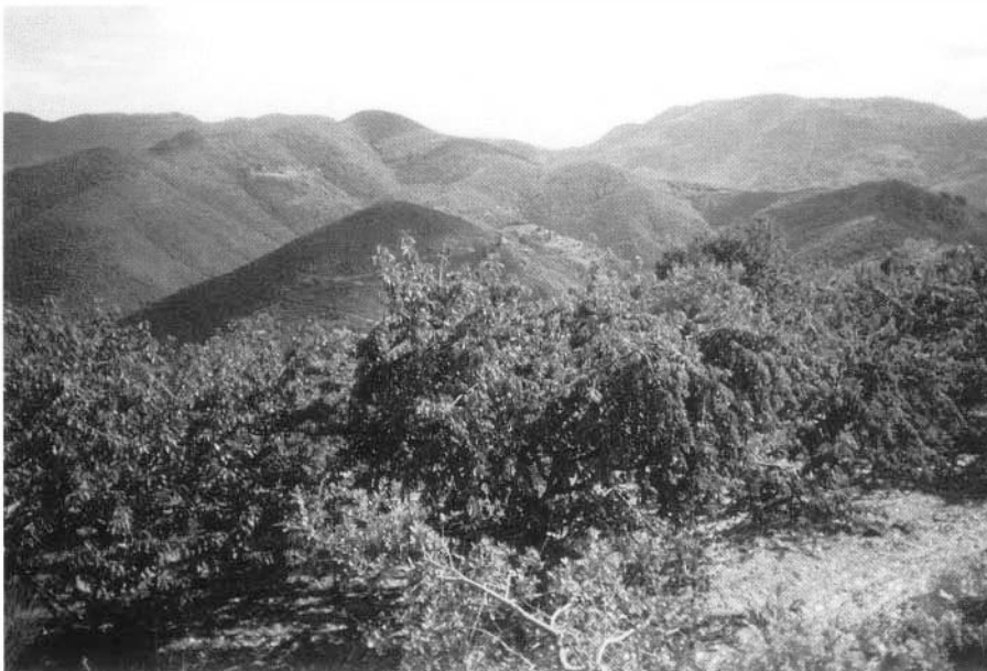
Photo 4 : Fermeture du paysage par la forêt dans les Cévennes méridionales et préservation d'îlots d'activités agricoles (vergers de cerises en terrasses au premier plan - secteur d'application d'une opération locale "préservation des paysages de châtaigneraies et de terrasses en Cévennes").

Un projet d'aménagement est généralement engagé à la suite d'une sollicitation émanant d'une collectivité ou d'une administration. A partir de cette sollicitation, les étapes successives du projet passent justement par la forma-