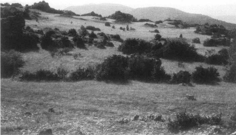
Photo 2 : Maintien par le pâturage du paysage ouvert caractéristique ("steppe") des causses méridionaux (Hérault - Causse du Larzac méridional).

Cependant, si l'idée de "paysage" peut être une des façons de synthétiser les différentes préoccupations à propos du rôle de l'espace rural, l'application réelle de ces mesures pose à l'heure actuelle un certain nombre de questions.