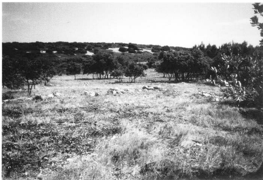
Photo 3 : Pare-feu arboré à caractère paysager avant mise en place d'un pâturage d'entretien par des ovins (Hérault, Massif de la Gardiole).

Toutefois de nombreuses difficultés peuvent apparaître lorsque le paysage devient un objectif prioritaire. Cela tend à être le cas en région méditerranéenne avec le développement du tou-