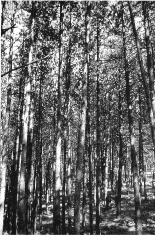
Photo 3 : Aspect typique d'un peuplement de 60 ans jamais éclairci. La nécessité de réduire la densité s'oppose à la fragilité structurale (Toscane).