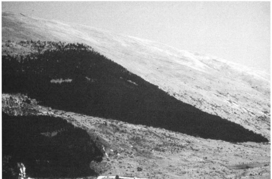
Photo 5 : Reboisement essentiellement de protection dans les Marches. Le non-traitement semble le choix de gestion le plus logique.

Dans ce dernier cas, qui mène à l'application d'une sylviculture de rétablissement et d'amélioration, il faut considérer les éléments esthétiques, la valeur du paysage et la fonction récréative attribués au reboisement. Ces éléments en effet contribuent, souvent et dans une mesure importante, aux