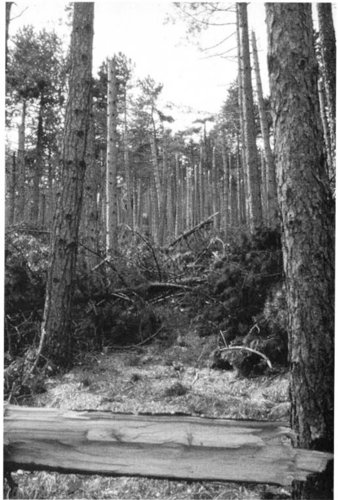
Photo 4 : Important effondrement structural dû à d'abondantes chutes de neige (Apennin Ombrien).