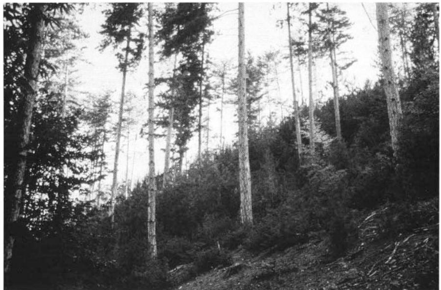
Photo 6 : Pinède de bonne fertilité dans les Apenins des Abruzzes. Le traitement a favorisé l'évolution optimale du cycle de reboisement; la régénération naturelle est assurée.

décisions opérationnelles et d'aménagement.