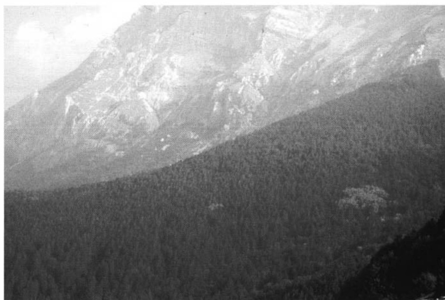
Photo 2 : Remarquable exemple de reconstitution du couvert forestier: pinède adulte sur les pentes du Monte Vettore (Apennin calcaire central).

privilégier les hautes valeurs de densité et de recouvrement du sol vis-à-vis des exigences d'équilibre du peuplement artificiel.