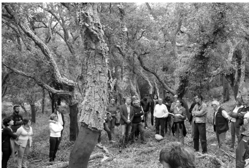
Photo 1 : Visite au Domaine des Campaux lors des 3 es Journées techniques du liège, octobre 2015.