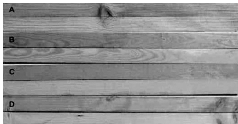
Fig. 2 : Eprouvettes de pin d'Alep après découpe dans le sens axial avant et après application du réactif chrome azurol S. (A) Duramen de pin d'Alep. (B) Aubier de pin d'Alep. (C) Témoin aubier de pin sylvestre. (D) Témoin épicéa.