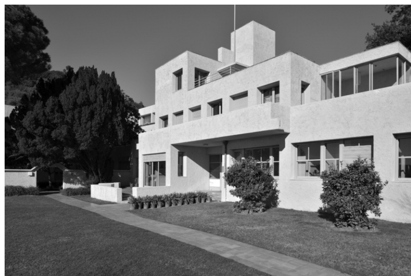
Photo 2 (ci-dessous) : Vue de la Villa Noailles à Hyères.