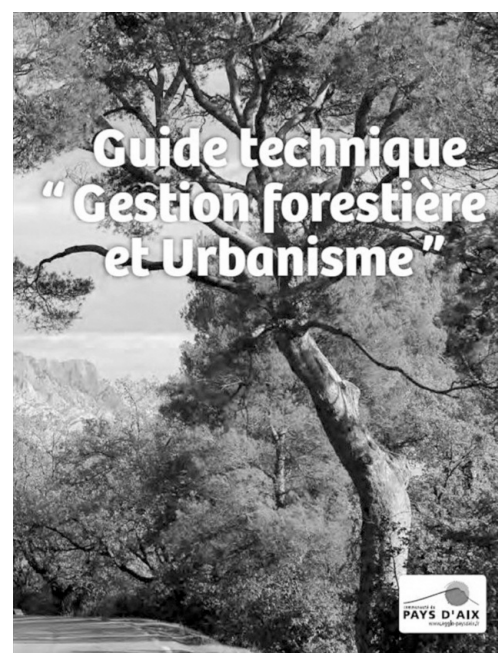
Fig. 3 : Guide technique - Gestion forestière et urbanisme.

Depuis de nombreuses années, la CPA constate lors de la réalisation des travaux DFCI ou lors d'échanges avec des services en charge de l'élaboration des PLU 10 ou SCOT 11 que la forêt est rarement mentionnée dans l'Etat initial de l'environnement ou dans les Orientations générales pour le PADD, le règlement et le Zonage.