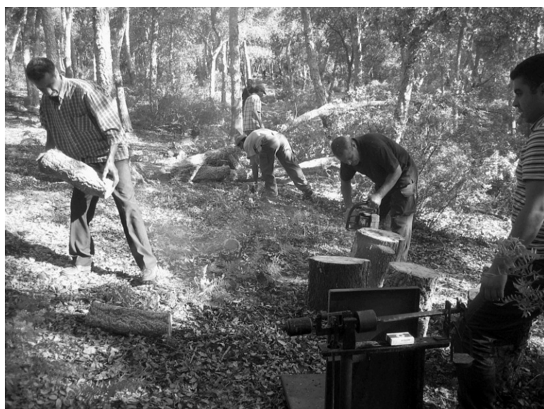
Tab. II : Comparaison des flux de carbone avec ceux d'autres écosystèmes méditerranéens (gC.m -2 .an -1 ).