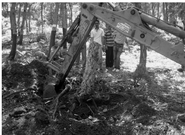
Photos 4 (ci-dessous) : Extraction des racines des arbres de chêne-liège à Bellif.