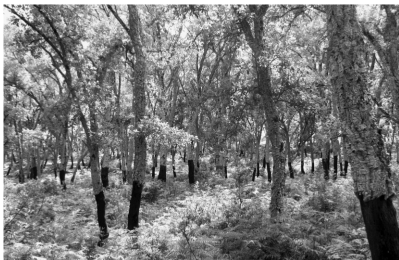
Photo 1 : Peuplement forestier monospécifique de chêne-liège à Bellif.

février de 5,6 °C et des maxima d'août de 34,4 °C. Les sols de la forêt sont dominés par des argiles et grès du flysch oligocène qui recouvrent des argiles calcaires d'âge éocène (DGF, 1997).