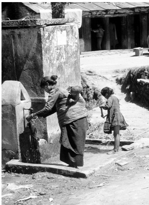
Photo 2 : Eau potable dans un village du Népal provenant d'une nappe aquifère forestière.

Les sols forestiers fonctionnent comme des éponges et retiennent l'eau bien plus longtemps que ceux qui sont soumis à d'autres usages. La déforestation augmente donc les risques de débordement et d'inondation en saison des pluies, tout comme elle entraîne des risques de sécheresse en saison sèche. Déforestation et reboisement ont de ce fait des effets opposés sur la quantité d'eau disponible. Il faut toutefois remarquer que le rôle des forêts et des arbres dans la régulation des inondations et des sécheresses prolongées est une affaire d'échelle : les forêts peuvent réduire les pics d'inondations et les surfaces concernées à petite échelle d'espace, sur de courtes périodes et à l'occasion d'événements pluvieux modérés. Mais l'étendue d'inondations de grande ampleur survenant dans la partie aval des bassins versants ne semble pas être liée au degré de couverture forestière ni aux méthodes de gestion sylvi-