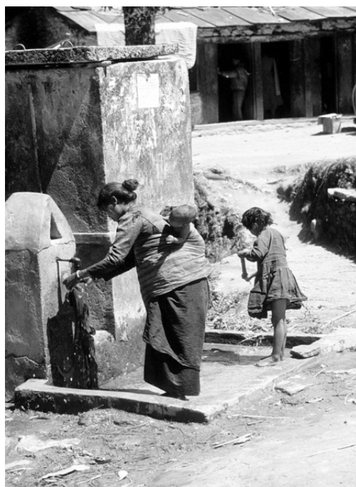
Photo 2 : Eau potable dans un village du Népal provenant d'une nappe aquifère forestière.

Les sols forestiers fonctionnent comme des éponges et retiennent l'eau bien plus longtemps que ceux qui sont soumis à d'autres usages. La déforestation augmente donc les risques de débordement et d'inondation en saison des pluies, tout comme elle entraîne des risques de sécheresse en saison sèche. Déforestation et reboisement ont de ce fait des effets opposés sur la quantité d'eau disponible. Il faut toutefois remarquer que le rôle des forêts et des arbres dans la régulation des inondations et des sécheresses prolongées est une affaire d'échelle : les forêts peuvent réduire les pics d'inondations et les surfaces concernées à petite échelle d'espace, sur de courtes périodes et à l'occasion d'événements pluvieux modérés. Mais l'étendue d'inondations de grande ampleur survenant dans la partie aval des bassins versants ne semble pas être liée au degré de couverture forestière ni aux méthodes de gestion sylvi-