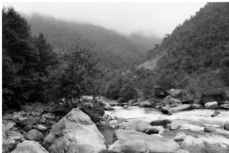
Photo 1 : Bassin versant forestier dans les Andes équatoriennes.

– l'époque de l'année : dans les régions soumises à un régime de mousson, par exemple, davantage d'eau s'infiltré dans le sol au début de la saison des pluies qu'à la fin, quand les sols sont gorgés d'eau et la nappe aquifère est proche de la surface du sol ;