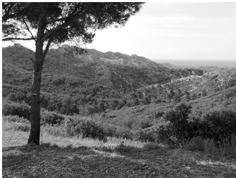
Photo 1 : Vue sur Saint-Rémy à partir de piste DFCI AL 110, pin d'Alep et falaises.