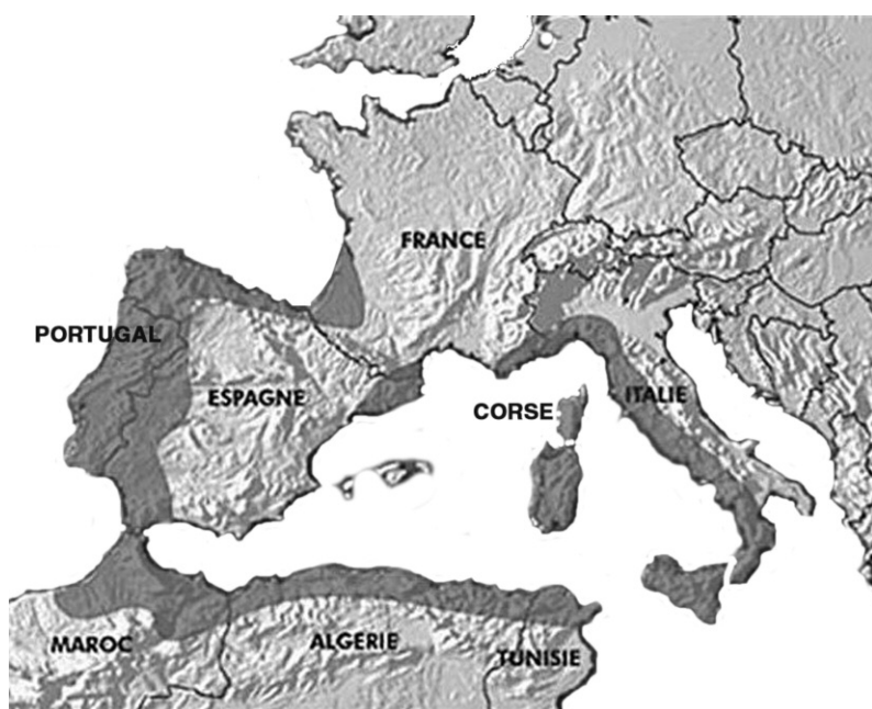
Fig. 1 (en haut) : Origines des bouchonniers espagnols de la Garde-Freinet et Pierrefeu entre 1876 et 1911. Laurie Strobant. Outils de réalisation: Google Map et Photofiltre.