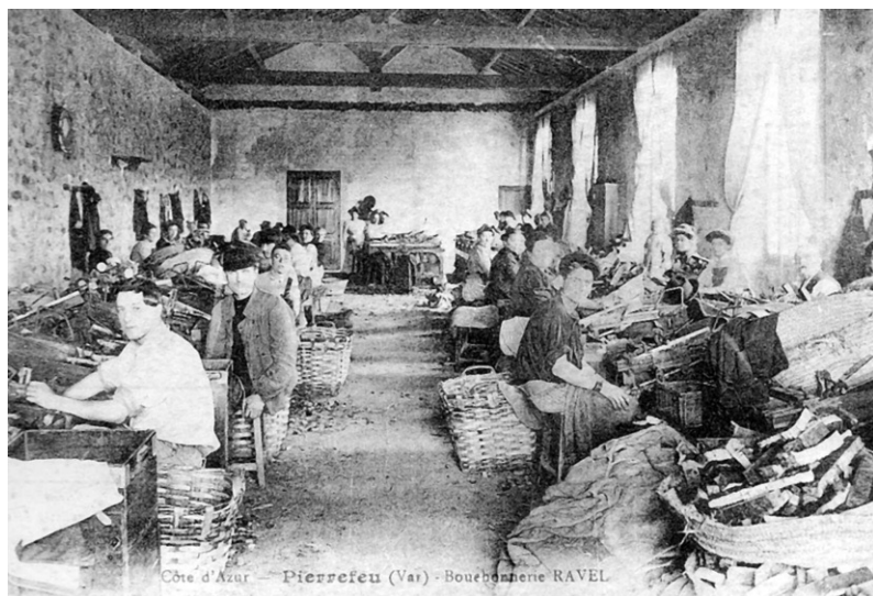
Photo 3 : Travail en bouchonnerie, Pierrefeu, 1906. Les métiers d'autrefois dans le département du Var , éditions du Cabri, p.135.

nelle pour ces migrants. En effet, les contacts entre le Piémont et la Provence sont très anciens et s'inscrivent dans l'héritage des migrations saisonnières 40 . Ces migrations sont traditionnellement des migrations de paysans. On en trouve des traces un peu partout en Provence 41 . L'origine rurale des Piémontais font de ces mobilités des migrations internes au monde rural s'inscrivant dans le cadre de l'ensemble des migrations saisonnières rurales qui s'opèrent en France, des circulations qui s'inscrivent d'ailleurs davantage dans le cadre de l'économie locale que nationale 42 .