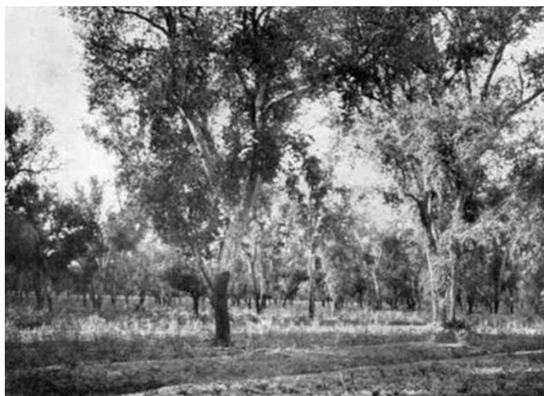
La forêt de Mamora : jeune futaie de chênes-lièges.

ouvriers andalous envoyés par les deux concessionnaires donnèrent la plus grande satisfaction, tant aux forestiers qu'aux « politiques », comme le précisait en juillet 1915 le colonel commandant la Région de Rabat au général Lyautey, qui suivait de très près ce dossier : tout est calme en Mamora, « [les ouvriers espagnols] sont bien des spécialistes de démasclage [et ils] ne s'occupent que de ce travail », et rien d'anormal n'a été remarqué après que la forêt « [...] ait été fouillée en tout sens » 40 ... Aussi l'expérience se renouvelait-elle en 1916 et puis plus modestement en 1917, à la grande satisfaction de Boudy qui ne manquait pas de souligner au général Lyautey combien les appréhensions poli-