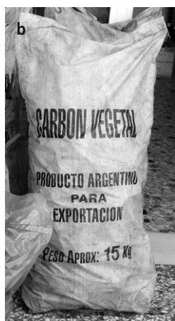
Photos 5 : Charbon « naturel » local (a) ou d'importation (b) (Eubée, Grèce).