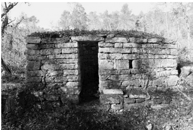
Photo 12 (à droite) : Pierrier offrant des possibilités pour se poster (Sainte-Anastasia, Var).

Photo 11 (à gauche) : Poste en pierres sèches sur l'adret de l'Agnis (Méounes, Var).