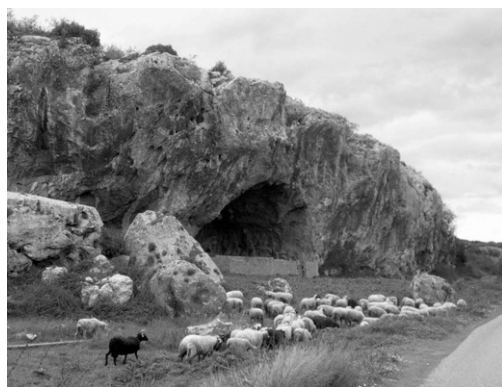
Photo 10 : Retour à la bergerie rupestre en Béotie en Grèce (rebords rocheux du lac asséché de Copais).

10 - Michel Derlange, par exemple, parle de « zonage » pour l'exercice des usages (Derlange, 2003).