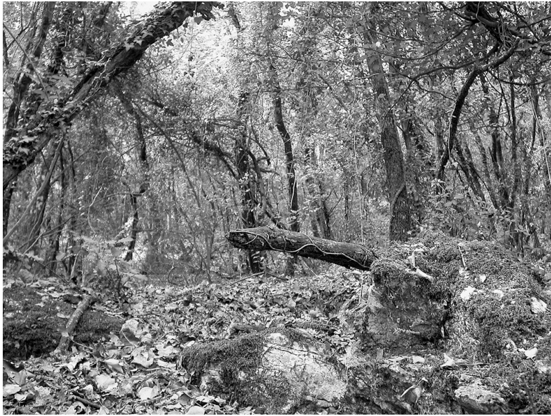
Photo 3 : Vieux chêne dans la forêt du Taulisson

des ambiances forestières favorables avec des peuplements âgés d'une centaine d'années (Cf. Photo 3).