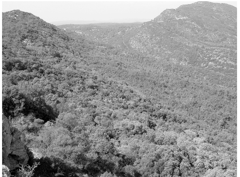
Photo 1 : Vue sur la chênaie verte depuis le Concors

Autres espèces caractéristiques, les oiseaux cavicoles (qui vivent dans les trous