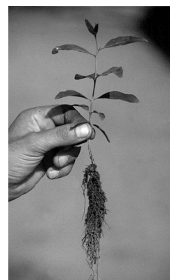
Photo 5 : Bouture ou semis ? Jeune plant issu du bouturage de clone sélectionné

Jean-Noël MARIEN Cirad, département environnement et sociétés, UR 105 Campus de Baillarguet 34398 Montpellier cedex 5 France Mél : marien@cirad.fr