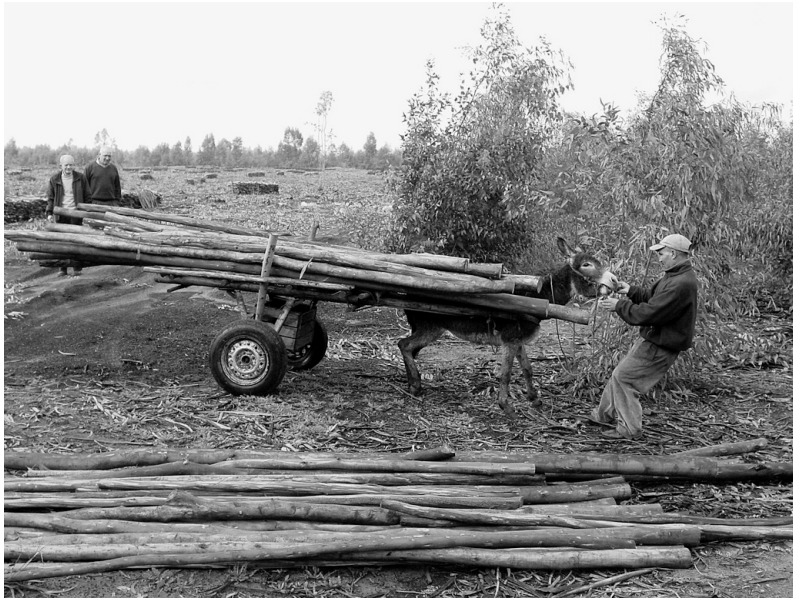
Photo 3 : Production de perches et poteaux à forte valeur ajoutée sur les parcelles clonales (Dar Bel Amri, 2010)

cis, prenant en considération les fonctions biologiques des cultures et les attentes économiques, sociales et écologiques des territoires plantés. Les nombreux ensembles de principes, critères, indicateurs et vérificateurs de gestion durable spécifiques aux plantations forestières existent et permettent, sinon de garantir la durabilité, du moins de diminuer les risques majeurs de dérives non durables.