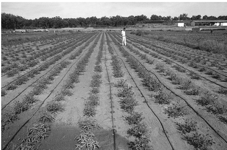
Photo 4 : Le parc à pieds mères du Centre de Sidi Amira en 1992

– ne pas élargir les zones de plantation au-delà des zones favorables ;